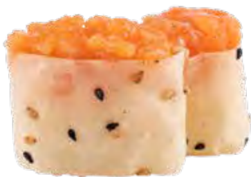
79 · SOY SALMON | € 3,50 🌶️ Bocconcini di riso avvolti con carta di soia con sesamo, guarniti con tartare di salmone (4 pezzi) allergeni: 1-2-6-11-15