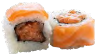
149 · JINO ROLL | € 13,00 🌶️ Roll di riso farcito con tartare di salmone, guarnito con fettine di salmone e salsa teriyaki (8 pezzi) allergeni: 1-4-6-15