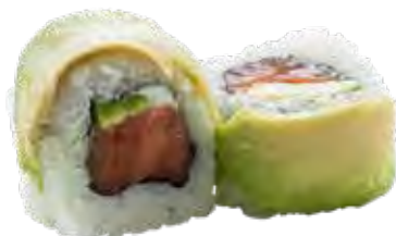
159 · DRAGON ROLL | € 12,00 Roll di riso farcito con salmone, avocado e Philadelphia, guarnito con avocado e salsa teriyaki (8 pezzi) allergeni: 1-4-6-7