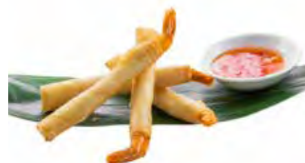
178 · EBI STICK | € 6,00 Involtino croccante di gambero fritto con salsa speciale (4 pezzi)