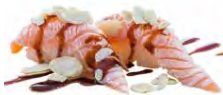
77 · NIGIRI MANDORLE | € 4,00 Bocconcini di riso con salmone scottato, mandorle e salsa teriyaki (6 pezzi) allergeni: 1-4-6-8