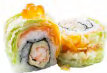
150 · EBITEN PLUS | € 12,00 Roll di riso farcito con gamberi in tempura, guarnito con salmone, fiori di zucca, ikura, maionese e salsa teriyaki (8 pezzi) allergeni: 1-2-3-4-6-7-10-15