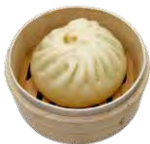
16 · BAOZI | € 5,00 Panino soffice a vapore ripieno con carne di maiale (5 pezzi)