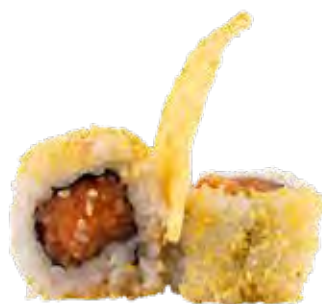
147 · TACOS ROLL | € 10,00 🌶️ Roll di riso farcito con tartare di salmone e jalapeno, guarnito con nachos e spicy mayo (8 pezzi) allergeni: 1-3-4-6-7