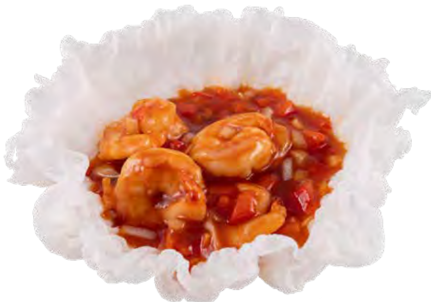
232 · GAMBERETTI THAI | € 8,00 🌶️