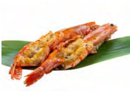
204 · EBI YAKI | € 10,00 Gamberoni alla griglia con sesamo e salsa teriyaki (4 pezzi)