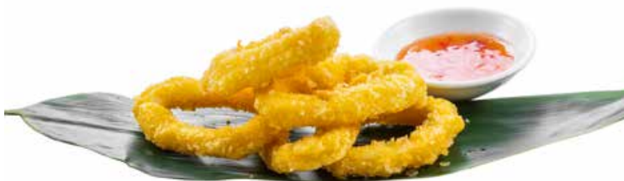
177 · IKA KARAGA | € 8,00 Frittura di calamaro impanato (8 pezzi)