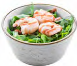
12 · COCKTAIL DI GAMBERETTI | € 6,00 Gamberetti con salsa rosa (5 pezzi)