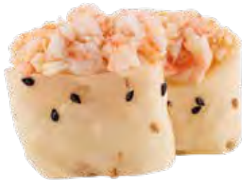
80 · SOY GAMBERO | € 4,00 🌶️ Bocconcini di riso avvolti con carta di soia con sesamo, guarniti con tartare di gambero (4 pezzi) allergeni: 1-2-11