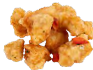
227 · POLLO SALE E PEPE | € 7,00 🌶️

Petto di pollo croccante con sale e pepe