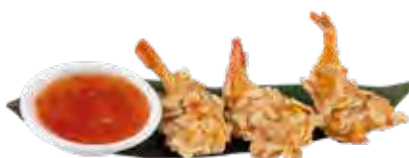
175 · EBI SHINJYO | € 8,00 Gamberi fritti con scaglie di mandorle (4 pezzi)