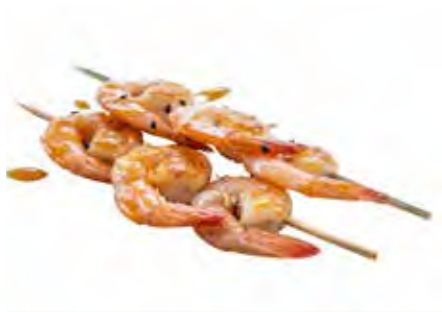
206 · EBI NO KUSHIYAKI | € 8,00 Spiedini di gamberetti alla griglia con sesamo e salsa teriyaki (6 pezzi)