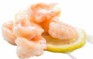
237 · GAMBERETTI AL LIMONE | € 8,00 Gamberetti con salsa al limone