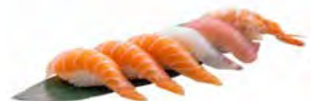
300 · NIGIRI MIX | € 6,00 Bocconcini di riso con pesce misto (6 pezzi) allergeni: 2-4