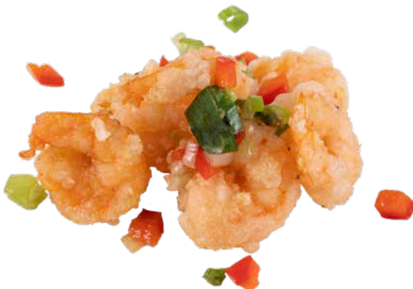
234 · GAMBERETTI DELLO CHEF | € 8,00 🌶️ Gamberetti sgusciati croccanti