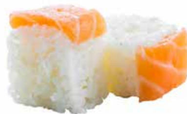
140 · SPECIAL ROLL | € 8,00 Roll di riso farcito con Philadelphia guarnito con salmone e salsa teriyaki (8 pezzi) allergeni: 1-4-6-7-11