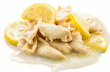
226 · POLLO AL LIMONE | € 6,00

Petto di pollo saltato con salsa al limone