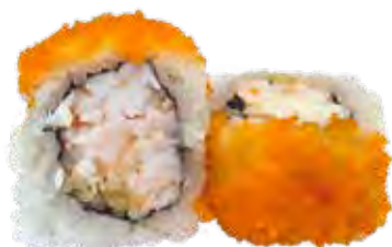
146 · YONG ROLL | € 9,00 Roll di riso farcito con gambero cotto e granella di tempura, guarnito con tobiko e conditi con salsa teriyaki (8 pezzi) allergeni: 1-2-6-15