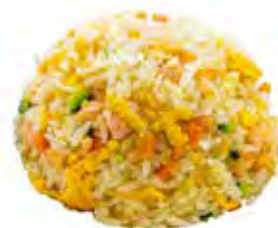
194 · RISO SALTATO CON SALMONE | € 6,00 Riso saltato con salmone, verdure miste e uova