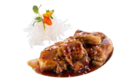
210 · YAKITORI | € 8,00 Pollo alla griglia con sesamo e salsa teriyaki