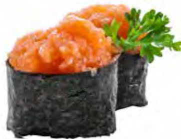
81 · SAKE | € 3,50 🌶️ Bocconcini di riso avvolti con alga nori, guarniti con tartare di salmone (4 pezzi) allergeni: 1-3-4-10-15