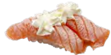
75 · SALMONE FLAMBÈ E PHILADELPHIA | € 4,00 Bocconcini di riso con salmone scottato, Philadelphia e salsa teriyaki (6 pezzi) allergeni: 1-4-6-7