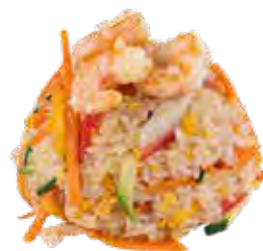
190 · KAISEN GOHAN | € 6,50 Riso saltato con frutti di mare, verdure miste e uova