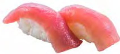
71 · MAGURO | € 4,00 Bocconcini di riso con tonno (6 pezzi)