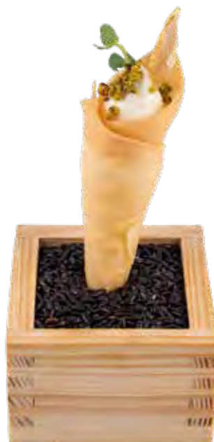
11 · MOUSSE SALMONE | € 6,00 Cono croccante di pasta sfoglia con mousse di salmone, Philadelphia, avocado e pistacchio allergeni: 1-4-6-7-8