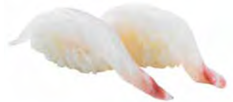
72 · TAI | € 3,00 Bocconcini di riso con branzino (6 pezzi)