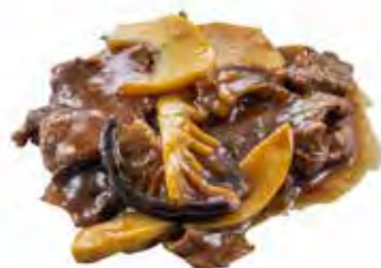
222 · MANZO CON FUNGHI E BAMBÙ | € 6,50 Bocconcini di manzo saltati con funghi e bambù