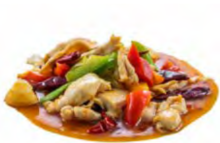
224 · POLLO AGROPICCANTE | € 6,00 🌶️

Petto di pollo saltato con verdure e salsa agropiccante