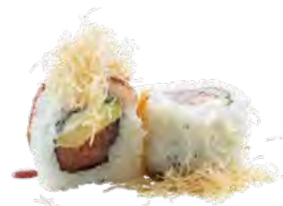
148 · FEVER | € 9,00 Roll di riso farcito con salmone, avocado e Philadelphia, guarnito con kataifi e salsa teriyaki (8 pezzi) allergeni: 1-4-6-7-11