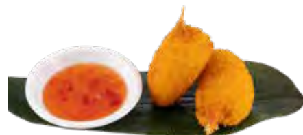
172 · CHELE DI GRANCHIO | € 6,00 Frittura di chele di granchio impanate (4 pezzi) allergeni: 1-2-3