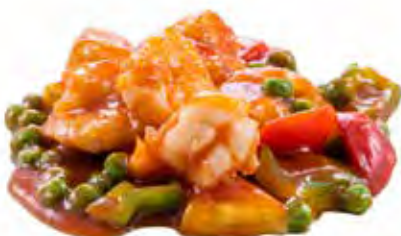
236 · GAMBERI AGRODOLCE | € 8,00 Gamberi con salsa agrodolce