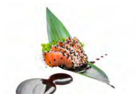
208 · SAKE TATAKI | € 8,00 Salmone scottato con sesamo e salsa teriyaki (10 pezzi)