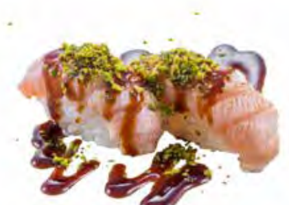
76 · SALMONE FLAMBÈ AL PISTACCHIO | € 4,00 Bocconcini di riso con salmone scottato, pistacchi e salsa teriyaki (6 pezzi) allergeni: 1-4-6-8