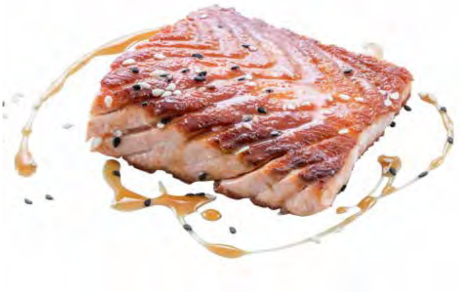
205 · SAKE YAKI | € 8,00 Salmone alla griglia con sesamo e salsa teriyaki (2 pezzi)