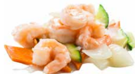
231 · GAMBERI AI CINQUE COLORI | € 8,00