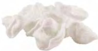
13 · NUVOLETTE DI DRAGO | € 2,50 Croccanti chips di tapioca e frutti di mare