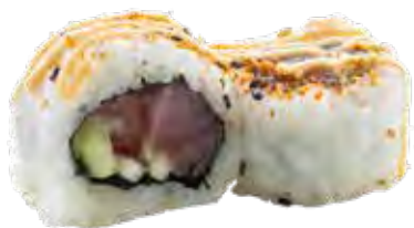
138 · SPICY MAGURO | € 9,00 🌶️ Roll di riso farcito con tonno, cetriolo, guarnito con shichimi e salsa piccante (8 pezzi) allergeni: 1-3-4-10-11