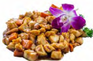
223 · POLLO ALLE MANDORLE | € 6,00 Petto di pollo saltato con mandorle e carote