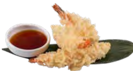
173 · EBI TEMPURA | € 12,00 Tempura di gamberi (4 pezzi)