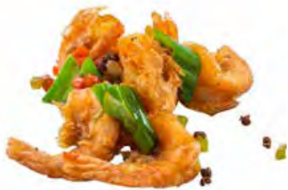
233 · GAMBERI SALE E PEPE | € 8,00 🌶️ Gamberi saltati con verdure