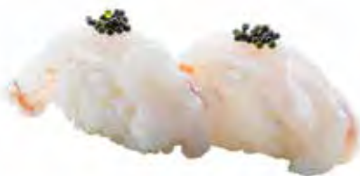
74 · AMAEBI | € 4,00 Bocconcini di riso con gambero crudo e tobiko (6 pezzi)