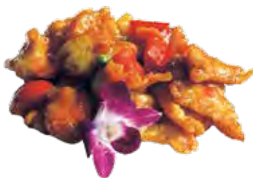
225 · POLLO IN AGRODOLCE | € 6,00

Petto di pollo saltato con salsa agrodolce