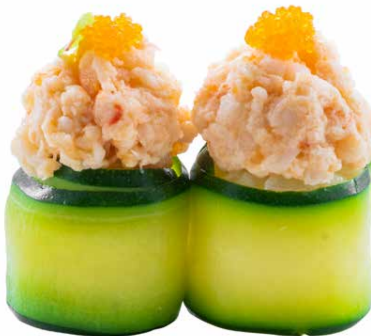
85 · ZUCCHINA | € 4,00 🌶️ Bocconcini di riso avvolti con zucchini tagliata sottile, guarniti con tartare di gamberi (4 pezzi) allergeni: 1-2-15