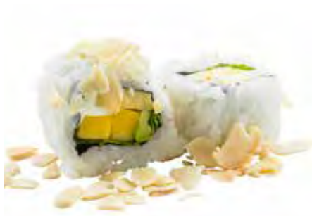
143 · VEGGIE ROLL | € 7,50 🌿 Roll di riso farcito con mango, avocado, Philadelphia e insalata, guarnito con scaglie di mandorle (8 pezzi) allergeni: 7-8-11