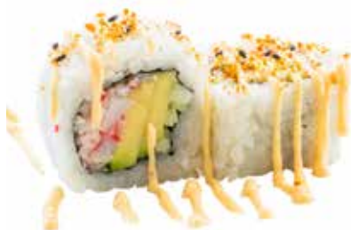
139 · SPICY CALIFORNIA | € 7,00 🌶️ Roll di riso farcito con granchio, avocado e cetriolo, guarnito con shichimi e salsa piccante (8 pezzi) allergeni: 1-2-3-10-11