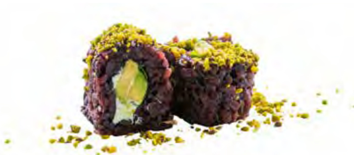
145 · JUST VEGETAL | € 8,00 🌿 Roll di riso venere farcito con avocado, Philadelphia e insalata, guarnito con granella di pistacchio (8 pezzi) allergeni: 7-8