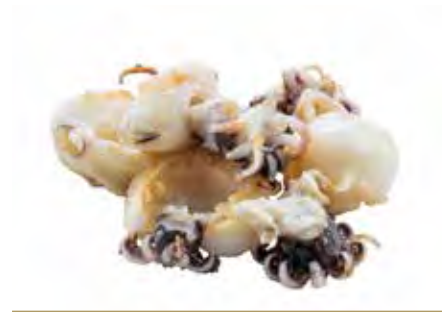
207 · SEPIOLINE ALLA GRIGLIA | € 8,00 Seppie alla griglia (6 pezzi)