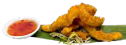
170 · TORIKARAGE | € 6,00 Bocconcini di pollo fritti