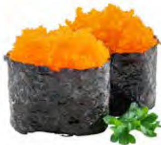
83 · TOBIKO | € 3,50 Bocconcini di riso avvolti con alga nori, guarniti con uova di pesce volante (4 pezzi) allergeni: 15