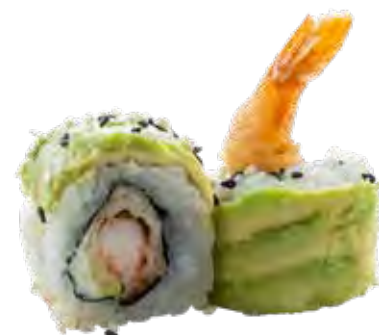
151 · SUPER DRAGON | € 10,00 Roll di riso farcito con tempura di gambero e Philadelphia, guarnito con avocado, sesamo e salsa teriyaki (8 pezzi) allergeni: 1-2-6-7-11