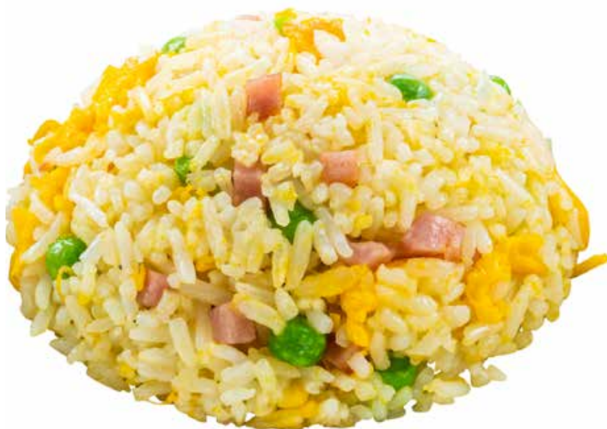
191 · RISO ALLA CANTONESE | € 4,50 Riso saltato con piselli, prosciutto cotto e uova