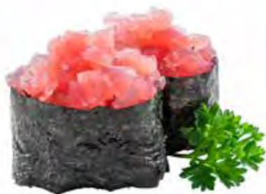
82 · MAGURO | € 4,50 Bocconcini di riso avvolti con alga nori, guarniti con tartare di tonno (4 pezzi) allergeni: 4