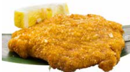
171 · COTOLETTA DI MAIALE | € 7,00 Cotoletta di maiale impanata