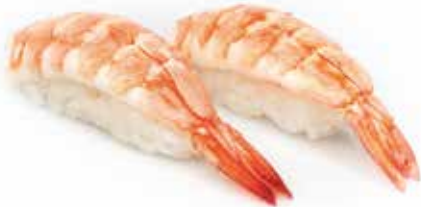
73 · EBI | € 3,00 Bocconcini di riso con gambero cotto (6 pezzi)