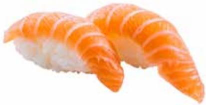
70 · SAKE | € 3,00 Bocconcini di riso con salmone (6 pezzi)