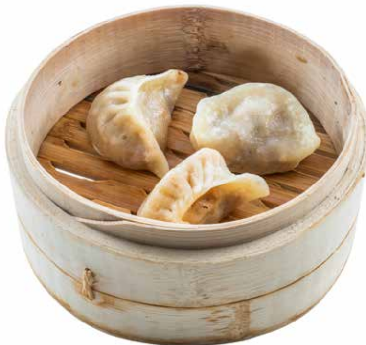
17 · RAVIOLI NIKU | € 4,50 Ravioli con carne e verdure (4 pezzi)