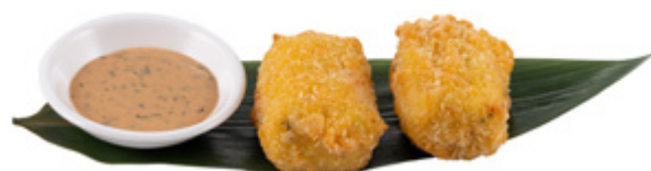
04 · CROCCHETTE DI SALMONE | € 5,00 Polpette croccanti di salmone e patate 4 PEZZI allergeni: 1-3-4-6-7