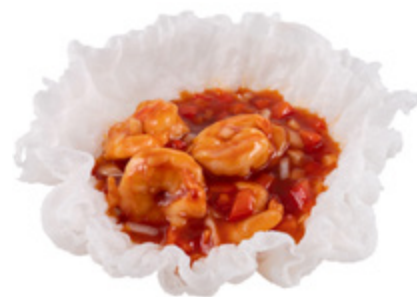
206 · GAMBERETTI THAI € 8,00 🌶️ Gamberetti alla thailandese allergeni: 1-2-3-6