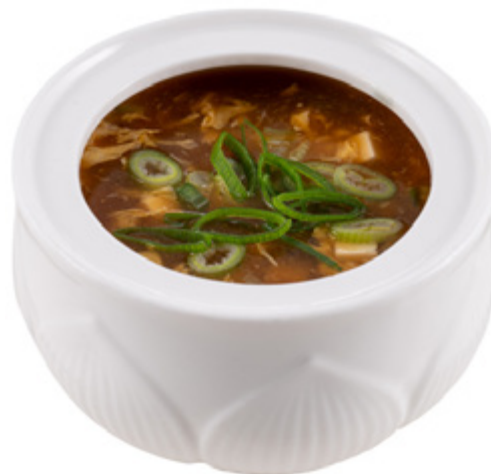
31 · ZUPPA AGROPICCANTE | € 4,00 🌶️ Zuppa di verdure con tofu, uovo, bambù e pollo allergeni: 1-3-6-14