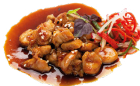
192 · YAKITORI | € 8,00 Pollo alla griglia con sesamo salsa teriyaki e porro allergeni: 1-6-11