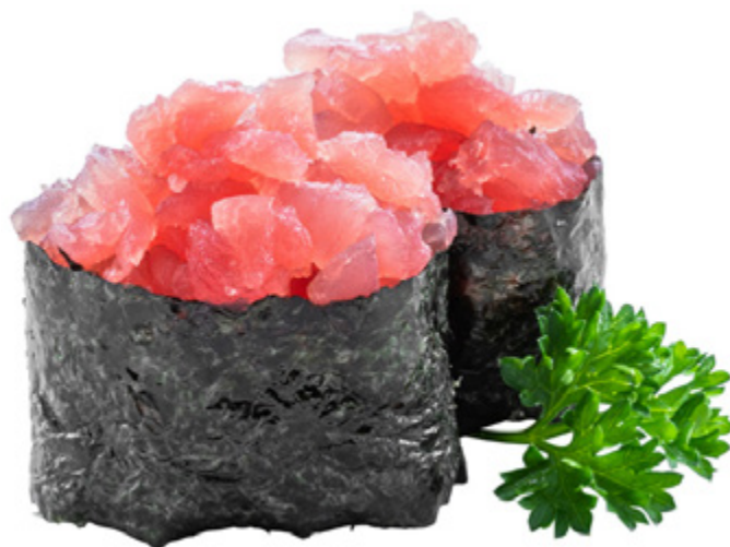
113 · MAGURO | € 4,50 Bocconcini di riso avvolti con alga nori, guarniti con tartare di tonno e tobiko* 4 PEZZI allergeni: 4