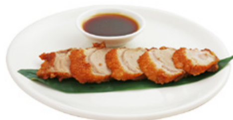
217 · ANATRA 5 AROMI | € 7,50 Anatra arrosto con un tocco di erbe aromatiche allergeni: 1-3-6-11