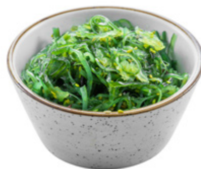
08 · GOMA WAKAME | € 4,50 🌿 🌶️ Alghe agropiccanti allergeni: 1-6-11