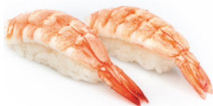
99 · EBI | € 3,50 Bocconcini di riso con gambero cotto 6 PEZZI allergeni: 2