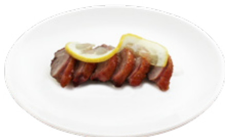
218 · ANATRA AL LIMONE € 7,50 Anatra arrosto con salsa di limone allergeni: 1-3-6