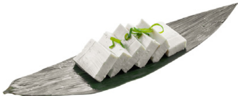
07 · TOFU | € 3,00 🌿 Tofu con salsa di soia allergeni: 1-6