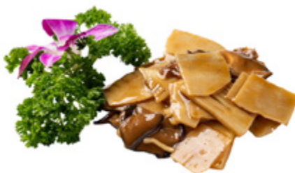
211 · FUNGHI E BAMBÙ € 4,00 🌿 Funghi* e bambù saltati allergeni: 1-6-14