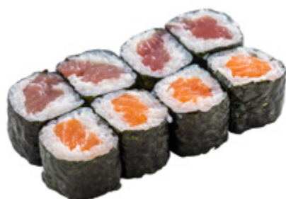
38 · HOSOMAKI MISTO € 5,50

Piccoli rotoli di riso avvolti con alga nori e farciti con pesce misto