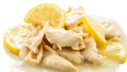
202 · POLLO AL LIMONE € 6,50

Petto di pollo saltato con salsa agrodolce allergeni: 3-6