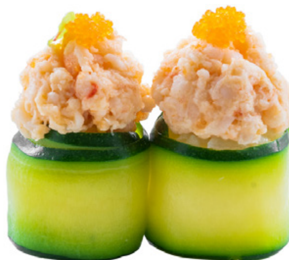
114 · ZUCCHINA | € 4,00 🍣 Bocconcini di riso avvolti con zucchini tagliata sottile, guarniti con tartare di gamberi e tobiko* 4 PEZZI allergeni: 1-2-3-4-6-10