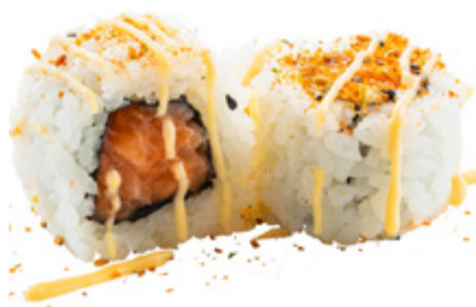
56 · SPICY SAKE | € 8,00 🌶️ Roll di riso farcito con tartare di salmone, cetriolo, guarnito con shichimi e salsa piccante 8 PEZZI allergeni: 1-3-4-6-10-11