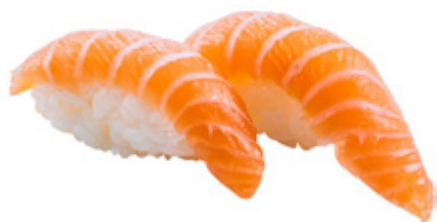
95 · SAKE | € 3,50 Bocconcini di riso con salmone 6 PEZZI allergeni: 4