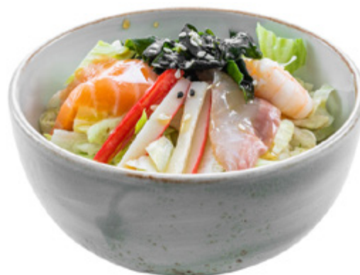
33 · GYOKAI SALAD | € 9,00 Insalata di mare con pesce misto crudo, sesamo e alghe allergeni: 1-2-4-6-11