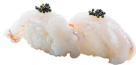
98 · AMAEBI | € 4,00 Bocconcini di riso con gambero crudo e tobiko* 6 PEZZI allergeni: 1-2-4-6