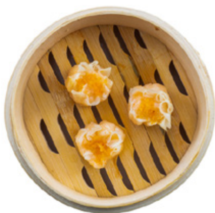
24 · RAVIOLI SHUMAY € 6,00 Ravioli con gamberi, carne, verdure e lardo 4 PEZZI allergeni: 1-2-3-4-6-9-11-12-14