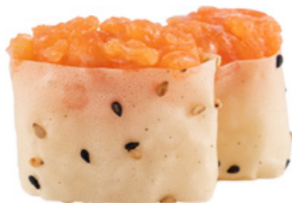
110 · SOY SALMON | € 3,50 🍣 Bocconcini di riso avvolti con carta di soia con sesamo, guarniti con tartare di salmone e tobiko* 4 PEZZI allergeni: 1-2-3-6-10-11