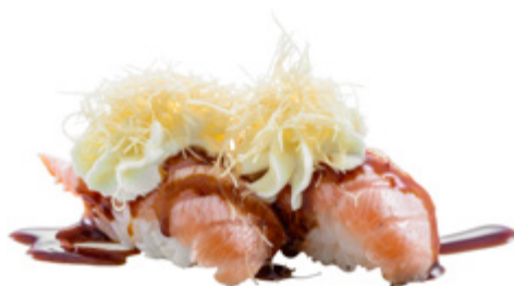
100 · SALMONE FLAMBÈ E PHILADELPHIA | € 4,50 Bocconcini di riso con salmone scottato, Philadelphia e salsa teriyaki 6 PEZZI allergeni: 1-4-6-7