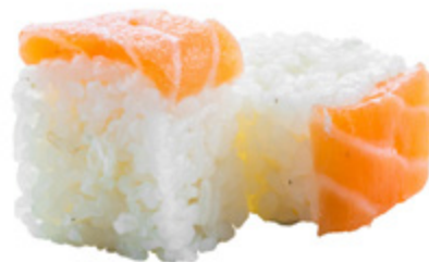
58 · SPECIAL ROLL | € 8,00 Roll di riso farcito con Philadelphia guarnito con salmone e salsa teriyaki 8 PEZZI allergeni: 1-4-6-7