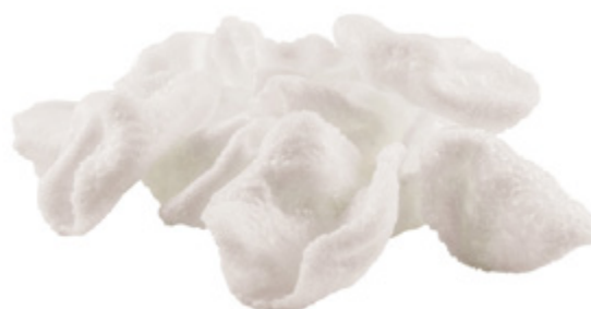
06 · NUVOLETTE DI DRAGO | € 2,50 Croccanti chips di tapioca e frutti di mare allergeni: 1-2