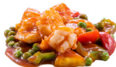
209 · GAMBERI AGRODOLCE | € 9,00 Gamberi con salsa agrodolce allergeni: 2-3