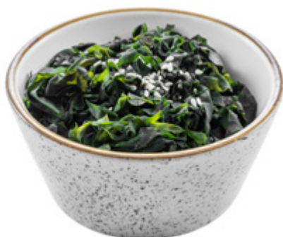
09 · WAKAME | € 4,50 🌿 Alghe con sesamo allergeni: 1-6-11