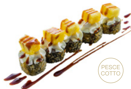
39 · HOSOMAKI FRITTO € 8,00

Piccoli rotoli di riso avvolti con alga nori, fritti e farciti con Philadelphia e salmone, guarniti con frutta di stagione e salsa teriyaki