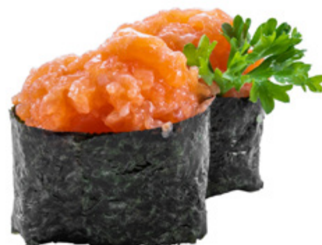
112 · SAKE | € 3,50 🍣 Bocconcini di riso avvolti con alga nori, guarniti con tartare di salmone e tobiko* 4 PEZZI allergeni: 1-3-4-6-10