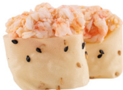
111 · SOY GAMBERO | € 4,00 🍣 Bocconcini di riso avvolti con carta di soia con sesamo, guarniti con tartare di gambero e tobiko* 4 PEZZI allergeni: 1-2-3-4-6-10-11