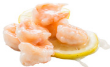
210 · GAMBERETTI AL LIMONE | € 8,00 Gamberetti con salsa al limone allergeni: 2-3