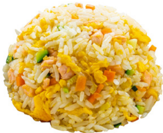
169 · RISO SALTATO CON SALMONE | € 6,50 Riso saltato con salmone, verdure miste e uova allergeni: 1-3-4