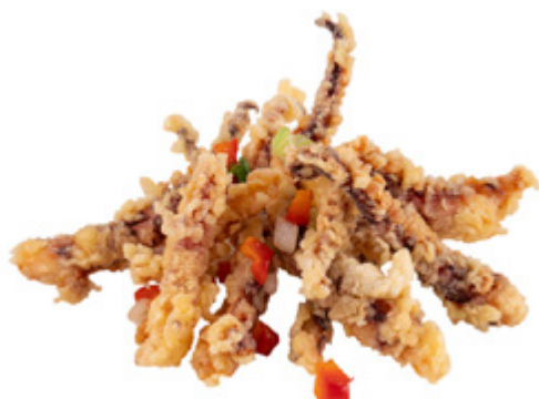
213 · CALAMARO SALE E PEPE | € 7,00 🌶️ Ciuffi di calamaro sale e pepe allergeni: 1-3-14