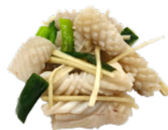
220 · SEPPIE ALLO ZENZERO | € 8,00 Seppie saltate con zenzero e porro allergeni: 14