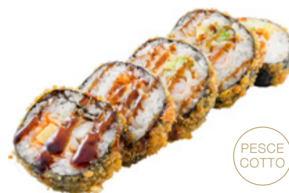
42 · FUTOMAKI FRITTO | € 9,00

Grandi rotoli di riso avvolti con alga nori, fritti e farciti con gambero, avocado e tobiko*