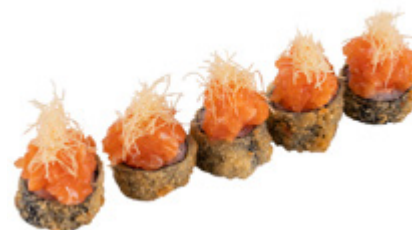
40 · HOSOMAKI SPICY SALMON | € 9,00

Piccoli rotoli di riso avvolti con alga nori, fritti e farciti con salmone, tartare di salmone, salsa teriyaki e kataifi