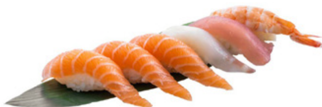
106 · NIGIRI MIX | € 6,50 Bocconcini di riso con pesce misto 6 PEZZI allergeni: 1-2-3-4-6-8-10