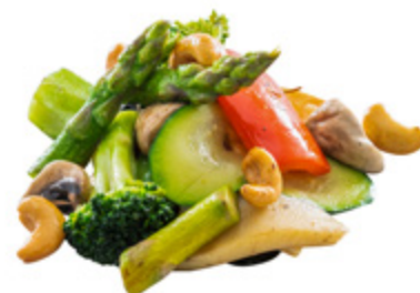
212 · VERDURE MISTE € 4,00 🌿 Verdure miste di stagione saltate con funghi* allergeni: 6-8-11