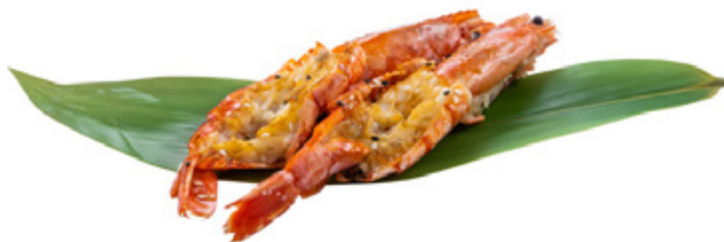
185 · EBI YAKI | € 10,00 Gamberoni alla griglia con sesamo e salsa teriyaki 4 PEZZI allergeni: 1-2-6-11