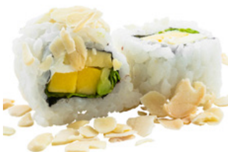
60 · VEGGIE ROLL | € 7,50 🌿 Roll di riso farcito con mango, avocado, Philadelphia e insalata, guarnito con scaglie di mandorle 8 PEZZI allergeni: 7-8