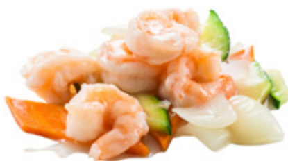
205 · GAMBERI AI CINQUE COLORI | € 8,00 Gamberi con cinque tipi di verdure allergeni: 2-3-9