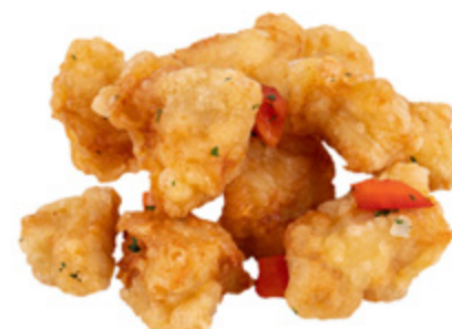
200 · POLLO SALE E PEPE € 7,00 🌶️

Petto di pollo saltato con verdure e salsa agropiccante allergeni: 1-3-6-14