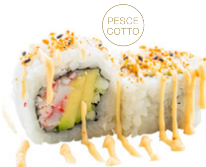
57 · SPICY CALIFORNIA € 7,50 🌶️ Roll di riso farcito con granchio, avocado e cetriolo, guarnito con shichimi e salsa piccante tobiko* 8 PEZZI allergeni: 1-2-3-4-6-10-11