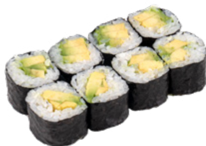
36 · HOSOMAKI AVOCADO € 3,50

Piccoli rotoli di riso avvolti con alga nori e farciti con avocado