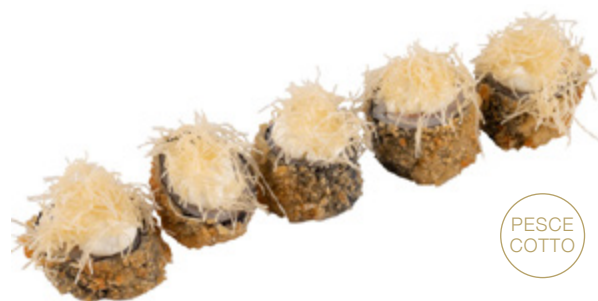
41 · HOSOMAKI NIDO | € 9,00

Piccoli rotoli di riso avvolti con alga nori, fritti e farciti con salmone, guarniti con Philadelphia, kataifi e salsa teriyaki