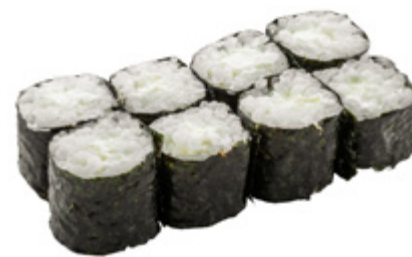
37 · HOSOMAKI PHILADELPHIA | € 4,00

Piccoli rotoli di riso avvolti con alga nori e farciti con Philadelphia