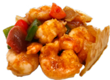
204 · GAMBERI AL CURRY € 8,00 🌶️ Gamberi con salsa al curry e verdure allergeni: 2-3