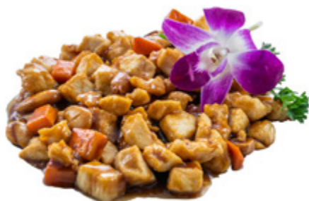
198 · POLLO ALLE MANDORLE | € 6,50

Bocconcini di manzo saltati con funghi* e bambù allergeni: 1-3-6-14