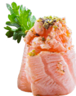
120 · GUNKAN PISTACCHIO € 5,00 🌶️

Bocconcini di riso avvolti con salmone, guarniti con tartare di salmone condita con salsa speziata tobiko* 4 PEZZI allergeni: 1-3-4-6-10