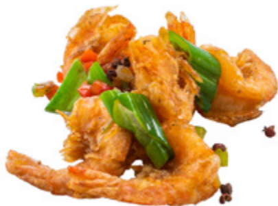
207 · GAMBERI SALE E PEPE | € 8,00 🌶️ Gamberi saltati con verdure allergeni: 1-2-3