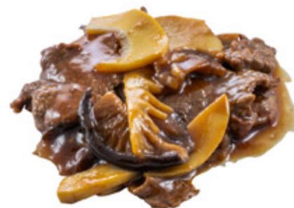
197 · MANZO CON FUNGHI E BAMBÙ | € 6,50

Bocconcini di manzo saltati con peperoncino ed erba cipollina allergeni: 1-3-6-14