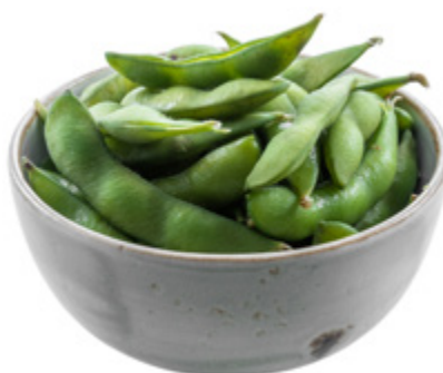
10 · EDAMAME | € 4,50 🌿 Baccelli di soia allergeni: 6