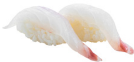
97 · TAI | € 3,50 Bocconcini di riso con branzino 6 PEZZI allergeni: 4