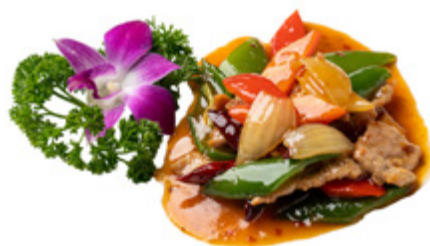
196 · MANZO PICCANTE € 6,50 🌶️🌶️

Bocconcini di manzo saltati con salsa di ostriche allergeni: 1-3-6-14