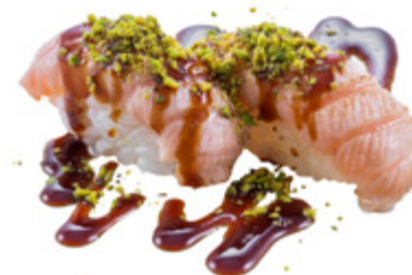
101 · SALMONE FLAMBÈ AL PISTACCHIO | € 4,50 Bocconcini di riso con salmone scottato, pistacchi e salsa teriyaki 6 PEZZI allergeni: 1-4-6-8