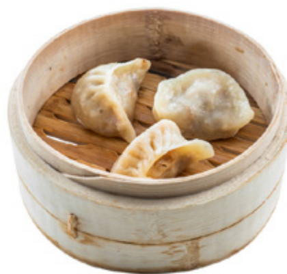
23 · RAVIOLI NIKU | € 5,50 Ravioli con carne e verdure 4 PEZZI allergeni: 1-2-3-4-6-8-9-10-12-14