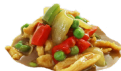
203 · POLLO AL CURRY € 6,50 🌶️

Petto di pollo saltato con salsa al limone allergeni: 3