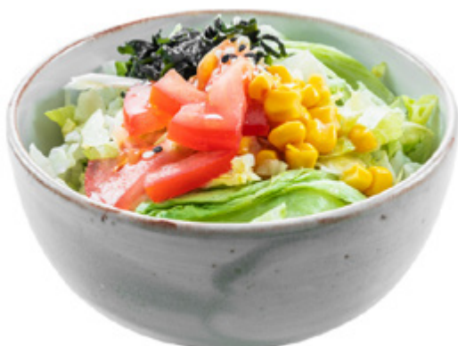
32 · YASAI SALAD | € 4,00 🌿 Insalata mista con alghe, mais, sesamo e pomodoro allergeni: 1-6-11