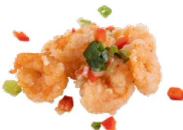
208 · GAMBERETTI DELLO CHEF | € 8,00 🌶️ Gamberetti sgusciati croccanti allergeni: 1-2-3