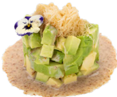
141 · TARTARE AVOCADO KATAIFI, SESAMO DRESSING | € 9,00 🌿

Tartare di avocado, kataifi, sesamo dressing allergeni: 1-3-6-11