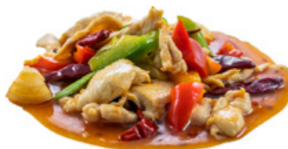
199 · POLLO AGROPICCANTE | € 6,50 🌶️

Petto di pollo saltato con mandorle e carote allergeni: 1-3-6-8-14