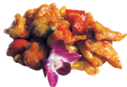
201 · POLLO IN AGRODOLCE | € 6,50

Petto di pollo croccante con sale e pepe allergeni: 1-3