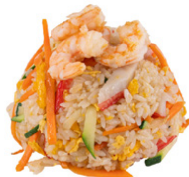
167 · KAISEN GOHAN | € 6,50 Riso saltato con frutti di mare, verdure miste e uova allergeni: 1-2-3-4-6-14