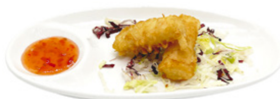
02 · HARUMAKI THAI | € 5,00 Involtino di pasta sfoglia con gamberi e lardo 4 PEZZI allergeni: 1-2-3-7-14