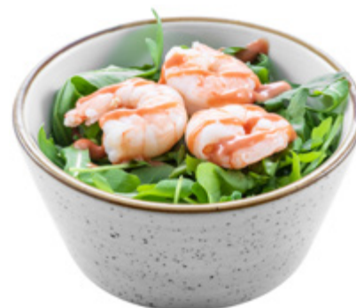
11 · COCKTAIL DI GAMBERETTI | € 6,00 8 PEZZI allergeni: 1-2-3-4-6-10