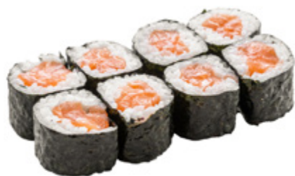
35 · HOSOMAKI SAKE € 5,00

Piccoli rotoli di riso avvolti con alga nori e farciti con salmone