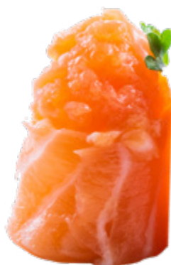
116 · GIO SPICY SALMON € 4,50 🌶️

Bocconcini di riso avvolti con salmone, guarniti con Philadelphia e frutta di stagione 4 PEZZI allergeni: 4-7