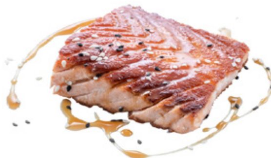
186 · SAKE YAKI | € 9,00 Salmone alla griglia con sesamo e salsa teriyaki 2 PEZZI allergeni: 1-4-6-11