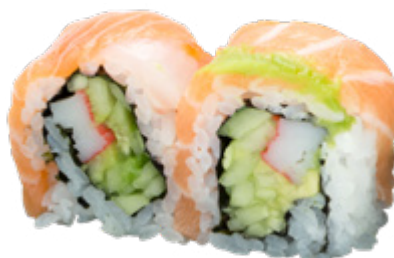
59 · RAINBOW ROLL | € 9,00 Roll di riso farcito con granchio, avocado e cetriolo, guarnito con pesce misto 8 PEZZI allergeni: 1-2-3-4-6-10