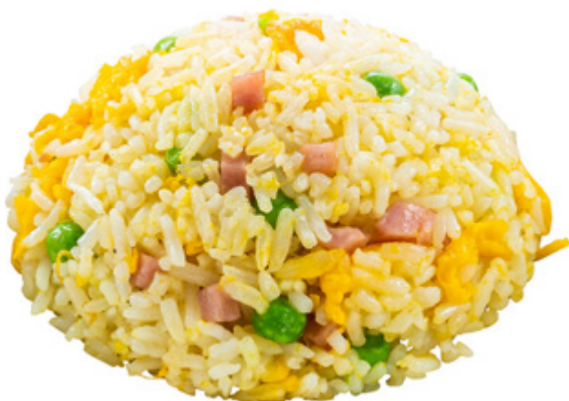
168 · RISO ALLA CANTONESE | € 4,50 Riso saltato con piselli, prosciutto cotto e uova allergeni: 1-3