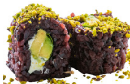
61 · JUST VEGETAL | € 8,00 🌿 Roll di riso venere farcito con avocado, Philadelphia e insalata, guarnito con granella di pistacchio 8 PEZZI allergeni: 7-8