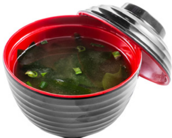
30 · ZUPPA DI MISO | € 3,00 Tradizionale zuppa a base di dashi e pasta di miso allergeni: 1-4-6