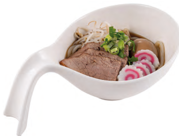
176 · RAMEN DI MANZO | € 10,00 Ramen in brodo, con uova, verdure e fette di manzo allergeni: 1-2-3-4-6-14