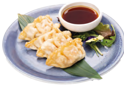
22 · GYOZA POLLO FRITTO € 5,50 Ravioli giapponesi fritti con pollo e verdure 5 PEZZI allergeni: 1-3-6-7-8