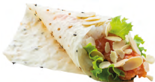
48 · SALMON ALMONDS | € 5,50 🌶️ Cono di riso avvolto con foglio di soia con sesamo, farcito con tartare di salmone, mandorle, lattuga e tobiko* allergeni: 1-3-4-6-8-10-11