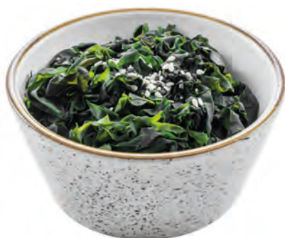
09 · WAKAME | € 4,50 🌿 Alghe con sesamo allergeni: 1-6-11