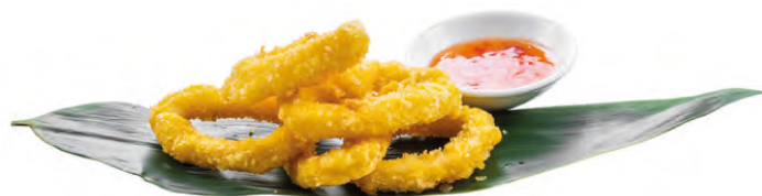
162 · IKA KARAGA | € 8,00 Frittura di calamaro impanato 8 PEZZI allergeni: 1-3-14