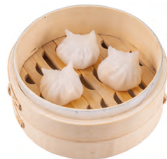
27 · GYOZA GAMBERO | € 7,50 Ravioli di pasta di riso ripieni di gamberi 5 PEZZI allergeni: 1-2-6-9-11-14