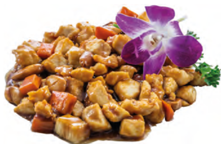
198 · POLLO ALLE MANDORLE | € 6,50 Petto di pollo saltato con mandorle e carote allergeni: 1-3-6-8-14