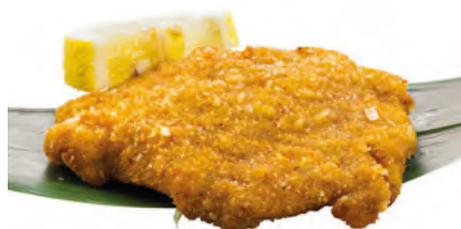
156 · COTOLETTA DI MAIALE | € 7,00 Cotoletta di maiale impanata allergeni: 1-3-6-11