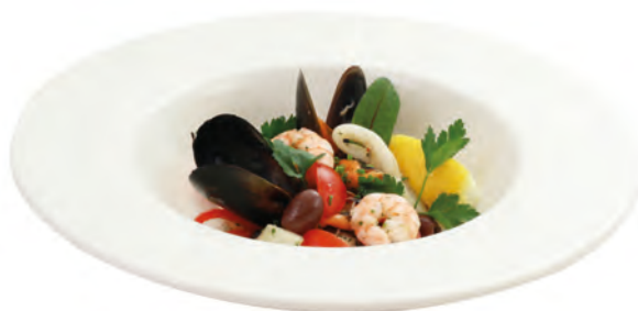
13 · INSALATA DI MARE | € 9,00 Misto di frutti di mare allergeni: 1-2-4-11-14