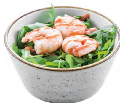
11 · COCKTAIL DI GAMBERETTI | € 6,00 Gamberetti con salsa rosa 8 PEZZI allergeni: 1-2-3-4-6-10