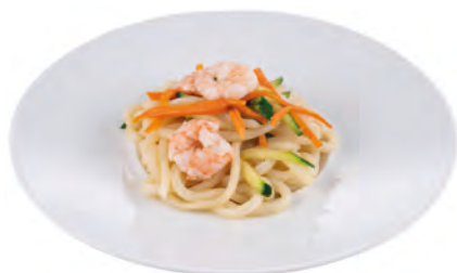
172 · EBI YAKI UDON | € 9,00 Spaghetti di farina di grano tenero (udon) saltati con gamberi, verdure e uova allergeni: 1-2-3-6-9-14