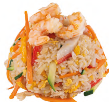
167 · KAISEN GOHAN | € 6,50 Riso saltato con frutti di mare, verdure miste e uova allergeni: 1-2-3-4-6-14