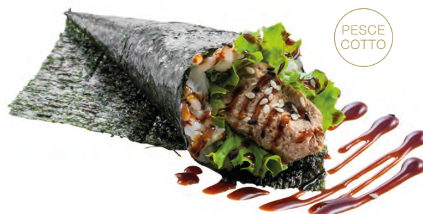
47 · SALMON SPECIAL | € 5,00 Cono di riso avvolto con alga nori, farcito con salmone cotto, insalata, Philadelphia, sesamo e salsa teriyaki allergeni: 1-4-6-7-11