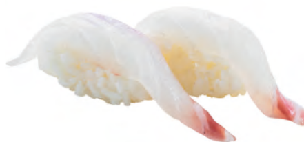
97 · TAI | € 3,50 Bocconcini di riso con branzino 3 PEZZI allergeni: 4