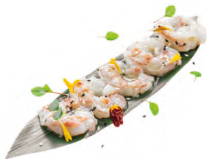
K4 · CARPACCIO AMAEBI € 12,00

Tartare di salmone con riso venere e Philadelphia, guarnita con pistacchio, tobiko* e salsa teriyaki allergeni: 1-3-4-6-7-8-10