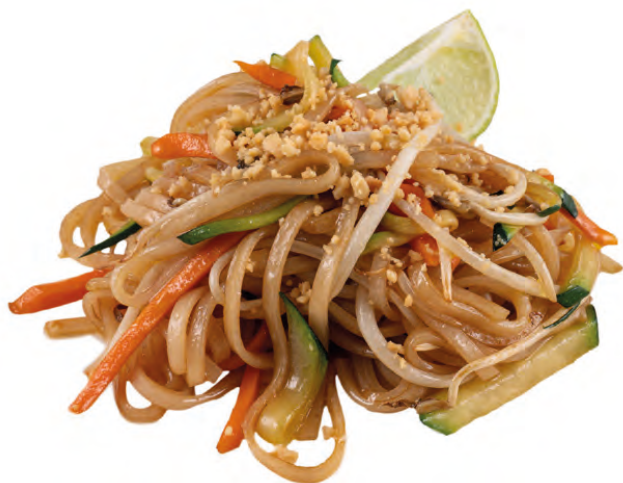
175 · PADTHAI PICCANTE | € 8,00 🌶 Pasta thailandese saltata con verdure, uovo e gamberi, granella di arachidi e peperoncini allergeni: 1-2-3-5-6-8-14