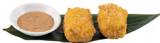
04 · CROCCHETTE DI SALMONE | € 5,00 Polpette croccanti di salmone e patate 4 PEZZI allergeni: 1-3-4-6-7