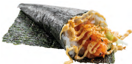
46 · SPICY SAKE | € 4,00 🌶️ Cono di riso avvolto con alga nori, farcito con salmone speziato, cetriolo e spicy mayo allergeni: 1-3-4-6-10-11