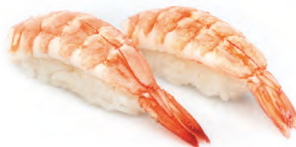
99 · EBI | € 3,50 Bocconcini di riso con gambero cotto 3 PEZZI allergeni: 2