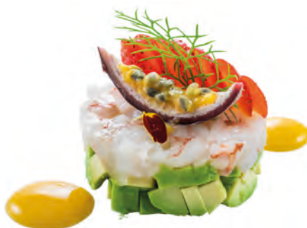
● K5 · TARTARE DI GAMBERO | € 14,00

Gambero crudo condito con salsa ponzu 12 PEZZI allergeni: 1-2-6-11