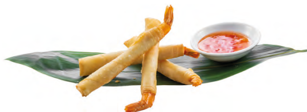
161 · EBI STICK | € 6,00 Involtino croccante di gambero fritto con salsa speciale 5 PEZZI allergeni: 1-2-3-7