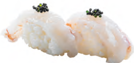
98 · AMAEBI | € 4,00 Bocconcini di riso con gambero crudo e tobiko* 3 PEZZI allergeni: 1-2-4-6