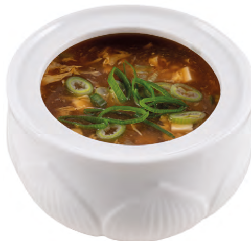
31 · ZUPPA AGROPICCANTE | € 4,00 🌶️ Zuppa di verdure con tofu, uovo, bambù e pollo allergeni: 1-3-6-14