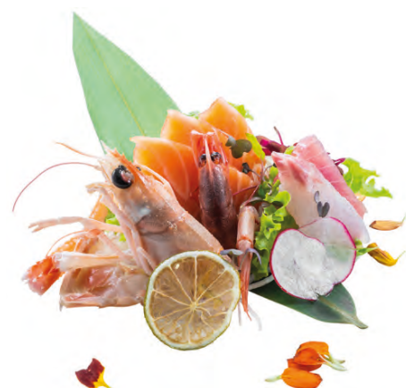
147 · SASHIMI MIX | € 16,00 Fettine di pesce misto e scampi 14 PEZZI allergeni: 2-4