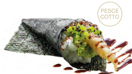
45 · EBITEN | € 5,00 Cono di riso avvolto con alga nori, farcito con tempura di gambero, insalata, sesamo e salsa teriyaki allergeni: 1-2-6-11