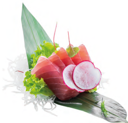
146 · SASHIMI TONNO € 12,00 Fettine di tonno crudo 10 PEZZI allergeni: 4