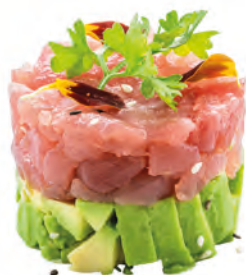
K2 · TUNA TARTARE € 14,00

Tartare di salmone con Philadelphia e avocado, guarnita con mandorle, tobiko* e salsa teriyaki allergeni: 1-3-4-6-7-8-10