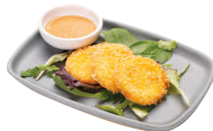
160 · POLPETTE DI GAMBERO | € 8,00 Polpetta croccante di gambero, besciamella, polpa di granchio 5 PEZZI allergeni: 1-2-3-4-6-7