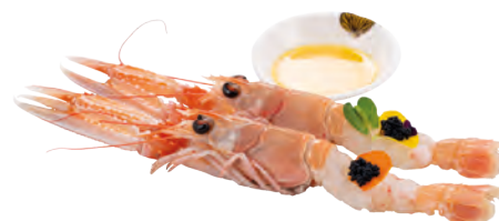
K6 · SCAMPI EMULSION € 12,00

Tartare di gambero crudo con avocado, fragola, passion fruit, e salsa mango allergeni: 2