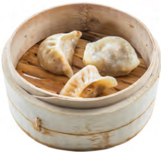
23 · RAVIOLI NIKU | € 5,50 Ravioli con carne e verdure 5 PEZZI allergeni: 1-2-3-4-6-8-9-10- 12-14