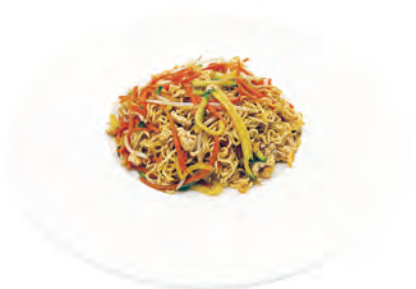
173 · RAMEN SALTATO CON POLLO | € 9,00 Ramen saltato con pollo, verdure e uova allergeni: 1-3-6-9-14