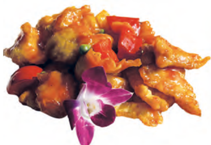
201 · POLLO IN AGRODOLCE | € 6,50 Petto di pollo saltato con salsa agrodolce allergeni: 3-6