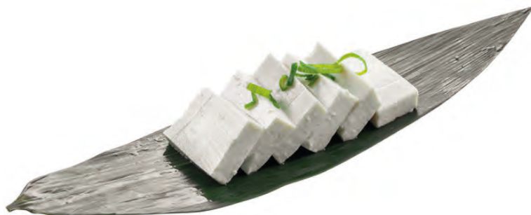
07 · TOFU | € 3,00 🌿 Tofu con salsa di soia allergeni: 1-6