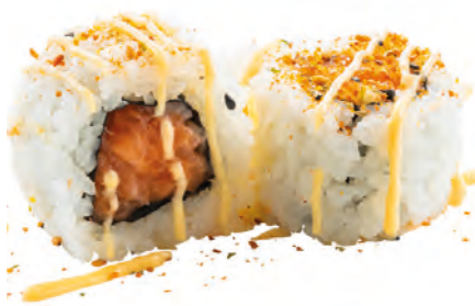
56 · SPICY SAKE | € 8,00 🌶️ Roll di riso farcito con tartare di salmone, cetriolo, guarnito con shichimi e salsa piccante 8 PEZZI allergeni: 1-3-4-6-10-11