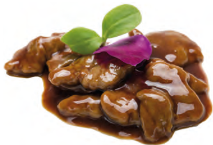
195 · MANZO SALTATO CON SALSA DI OSTRICHE € 6,50 Bocconcini di manzo saltati con salsa di ostriche allergeni: 1-3-6-14