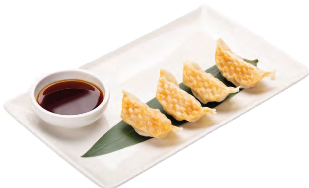
26 · EBI GYOZA GRILL | € 6,50 Ravioli alla griglia con gamberi e verdure 5 PEZZI allergeni: 1-2-3-6-7-8