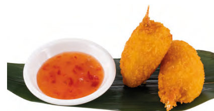
157 · CHELE DI GRANCHIO € 6,00 Frittura di chele di granchio impanate 4 PEZZI allergeni: 1-2-3-4-6