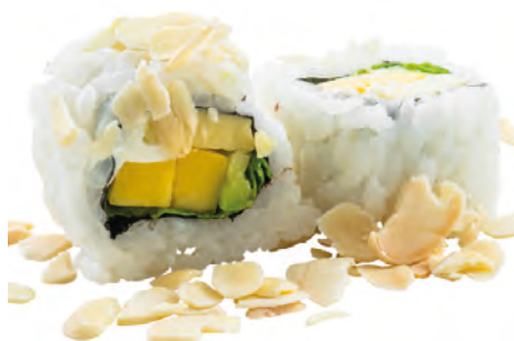
60 · VEGGIE ROLL | € 7,50 🌿 Roll di riso farcito con mango, avocado, Philadelphia e insalata, guarnito con scaglie di mandorle 8 PEZZI allergeni: 7-8