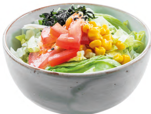
32 · YASAI SALAD | € 4,00 🌿 Insalata mista con alghe, mais, sesamo e pomodoro allergeni: 1-6-11