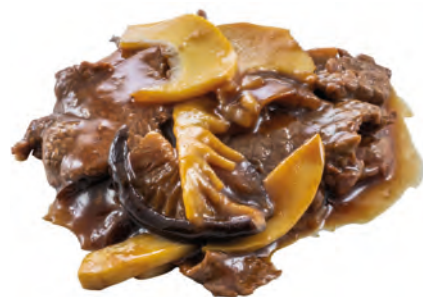
197 · MANZO CON FUNGHI E BAMBÙ | € 6,50 Bocconcini di manzo saltati con funghi* e bambù allergeni: 1-3-6-14