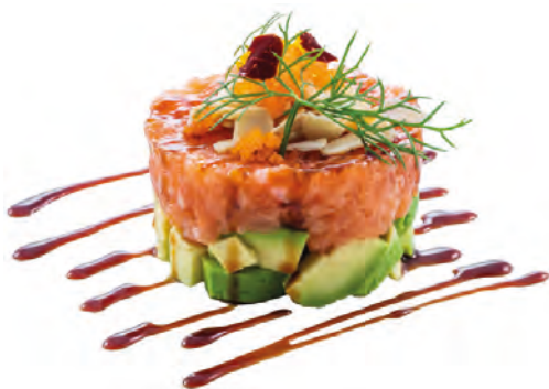
K1 · TARTARE MIHO € 14,00 🌶️

Tartare di salmone con Philadelphia e avocado, guarnita con mandorle, tobiko* e salsa teriyaki allergeni: 1-3-4-6-7-8-10