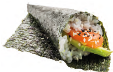
43 · SAKE AVOCADO | € 4,00 Cono di riso avvolto con alga nori, farcito con salmone, avocado e sesamo allergeni: 4-11