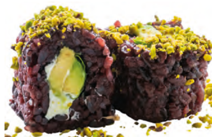
61 · JUST VEGETAL | € 8,00 🌿 Roll di riso venere farcito con avocado, Philadelphia e insalata, guarnito con granella di pistacchio 8 PEZZI allergeni: 7-8