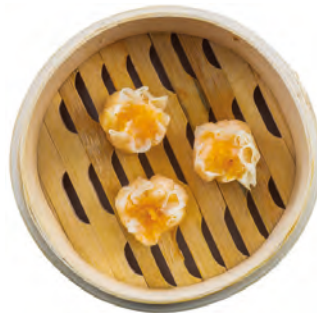
24 · RAVIOLI SHUMAY € 6,00 Ravioli con gamberi, carne, verdure e lardo 5 PEZZI allergeni: 1-2-3-4-6-9-11-12-14