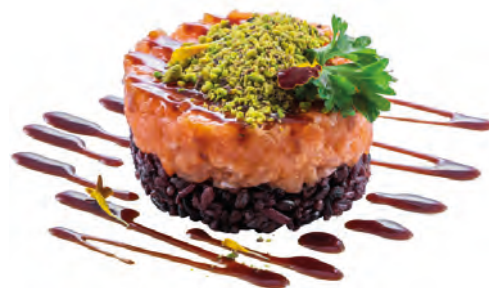
K3 · TARTARE DI SALMONE E PISTACCHIO | € 12,00 🌶️

Tartare di tonno con avocado condita con salsa yuzu e sesamo allergeni: 1-4-6-11