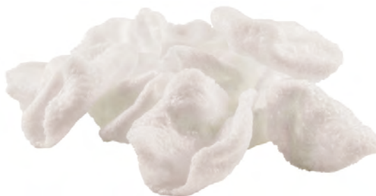
06 · NUVOLETTE DI DRAGO | € 2,50 Croccanti chips di tapioca e frutti di mare allergeni: 1-2