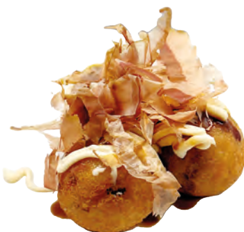
159 · TAKOYAKI | € 8,00 Polpette fritte di polipo e patate con maionese, salsa teriyaki e katsoubushi 5 PEZZI allergeni: 1-3-4-6-7-10-14