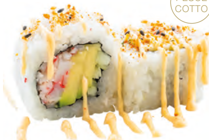
57 · SPICY CALIFORNIA € 7,50 🌶️ Roll di riso farcito con granchio, avocado e cetriolo, guarnito con shichimi e salsa piccante tobiko* 8 PEZZI allergeni: 1-2-3-4-6-10-11