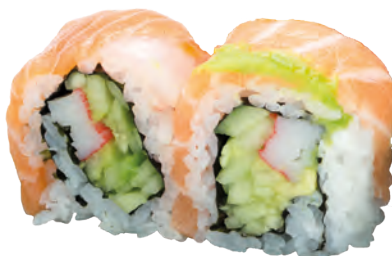
59 · RAINBOW ROLL | € 9,00 Roll di riso farcito con granchio, avocado e cetriolo, guarnito con pesce misto 8 PEZZI allergeni: 1-2-3-4-6-10