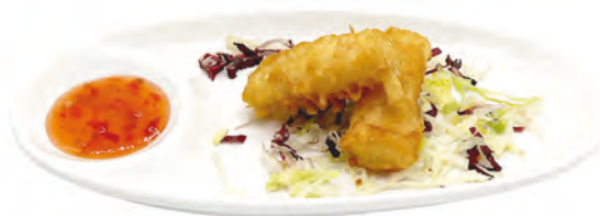
02 · HARUMAKI THAI | € 5,00 Involtino di pasta sfoglia con gamberi e lardo 4 PEZZI allergeni: 1-2-3-7-14