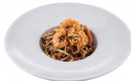
174 · EBI YAKISOBA | € 9,00 Spaghetti di grano saraceno (soba) saltati con salsa chef, gamberi, verdure e uova, guarniti con granella di arachidi allergeni: 1-2-3-6-8-9-11