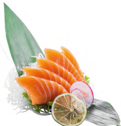
145 · SASHIMI SALMONE € 12,00 Fettine di salmone crudo 14 PEZZI allergeni: 4