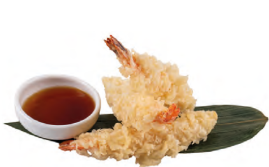
158 · EBI TEMPURA | € 12,00 Tempura di gamberi 5 PEZZI allergeni: 1-2