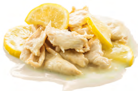
202 · POLLO AL LIMONE | € 6,50 Petto di pollo saltato con salsa al limone allergeni: 3