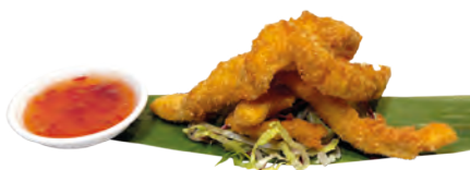
155 · TORIKARAGE | € 6,00 Bocconcini di pollo fritti allergeni: 1-3-6-11