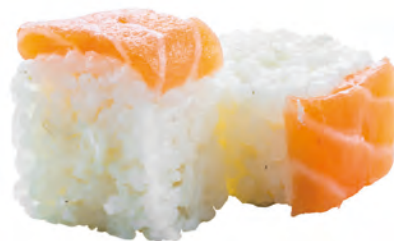
58 · SPECIAL ROLL | € 8,00 Roll di riso farcito con Philadelphia guarnito con salmone e salsa teriyaki 8 PEZZI allergeni: 1-4-6-7