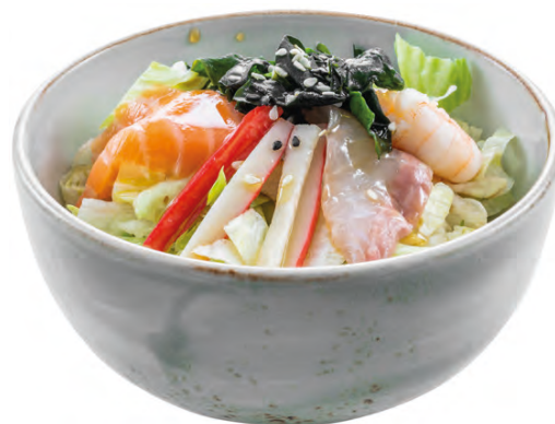
33 · GYOKAI SALAD | € 9,00 Insalata di mare con pesce misto crudo, sesamo e alghe allergeni: 1-2-4-6-11