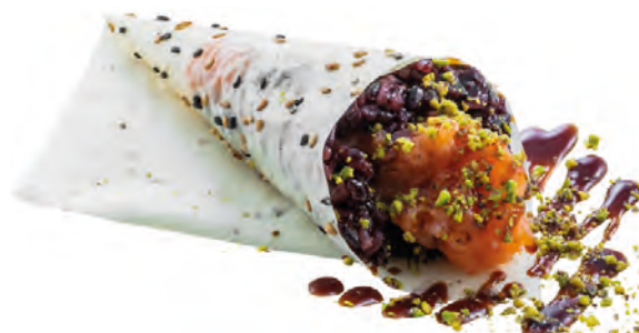
49 · VENUS | € 5,50 🌶️ Cono di riso venere avvolto con foglio di soia con sesamo, farcito con tartare di salmone, pistacchio, salsa teriyaki e tobiko* allergeni: 1-3-4-6-8-10-11