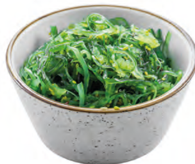
08 · GOMA WAKAME | € 4,50 🌿 🌶️ Alghe agropiccanti allergeni: 1-6-11