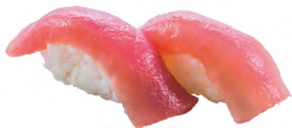
96 · MAGURO | € 4,00 Bocconcini di riso con tonno 3 PEZZI allergeni: 4