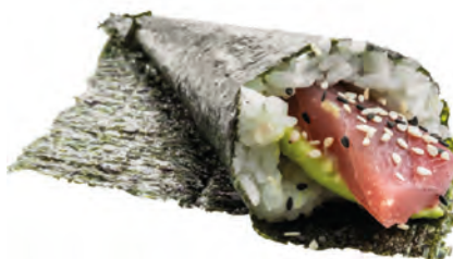
44 · MAGURO AVOCADO € 5,00 Cono di riso avvolto con alga nori, farcito con tonno, avocado e sesamo allergeni: 4-11