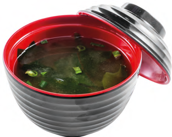
30 · ZUPPA DI MISO | € 3,00 Tradizionale zuppa a base di dashi e pasta di miso allergeni: 1-4-6