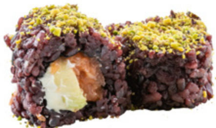
80 · SALMONE PISTACCHIO | € 12,00 Roll di riso venere farcito con salmone, avocado, Philadelphia, pistacchio e tobiko* 8 PEZZI allergeni: 1-4-7-8