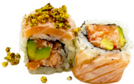
77 · ROLL SALMON SUMISO | € 14,00 🍣 Roll di riso farcito con tartare di salmone piccante e avocado, guarniti con salmone flambè, granella di pistacchio e yuzumiso 8 PEZZI allergeni: 1-3-4-6-8-10