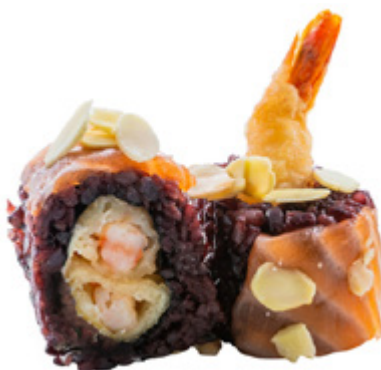
78 · EBI FLO' | € 12,00 Roll di riso venere farcito con gamberoni in tempura e Philadelphia, guarnito con salmone, mandorle e salsa teriyaki 8 PEZZI allergeni: 1-2-4-6-7-8