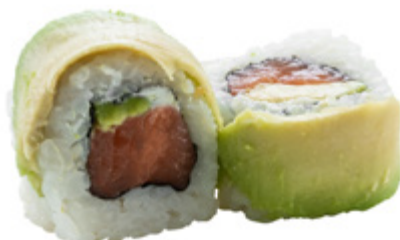
75 · DRAGON ROLL | € 12,00 Roll di riso farcito con salmone, avocado e Philadelphia, guarnito con avocado e salsa teriyaki 8 PEZZI allergeni: 1-4-6-7