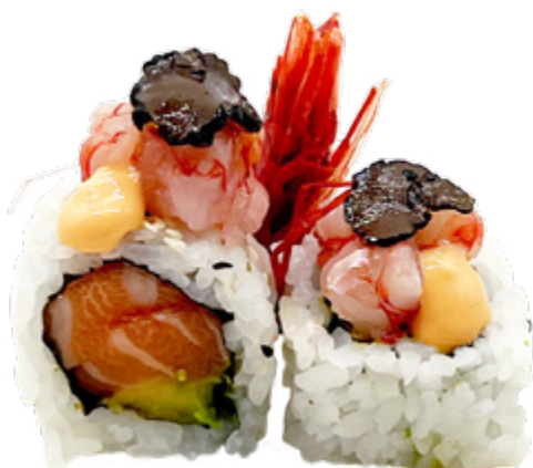
83 · ROLL TRUFFLE SHRIMP | € 14,00 Roll di riso farcito con salmone e avocado, guarnito con tartare di gambero crudo, tartufo e salsa rosa tobiko* 8 PEZZI allergeni: 1-2-3-4-6-7-10