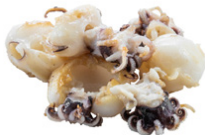
188 · SEPIOLINE ALLA GRIGLIA | € 9,00 Seppie alla griglia allergeni: 14