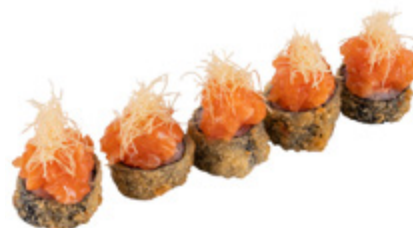
40 · HOSOMAKI SPICY SALMON | € 9,00

Piccoli rotoli di riso avvolti con alga nori, fritti e farciti con salmone, tartare di salmone, salsa teriyaki e kataifi