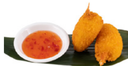
157 · CHELE DI GRANCHIO € 6,00

Cotoletta di maiale impanata allergeni: 1-3-6-11