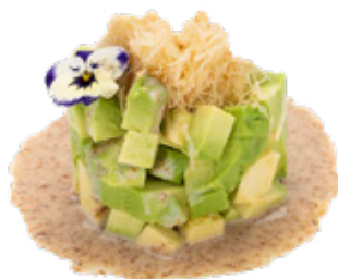
141 · TARTARE AVOCADO KATAIFI, SESAMO DRESSING | € 9,00

Tartare di salmone condita con salsa ponzu, granella di tempura e tobiko* allergeni: 1-3-4-6-10