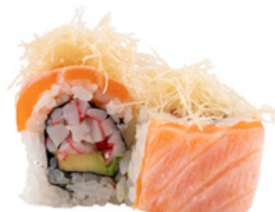
76 · IBIZA ROLL | € 12,00 🍣 Roll di riso farcito con polpa di granchio e avocado, guarnito con fettine di salmone flambè, kataifi, salsa piccante e salsa teriyaki tobiko* 8 PEZZI allergeni: 1-2-3-4-6-10