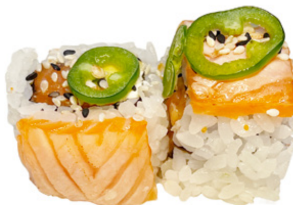
84 · ROLL SALMON JALAPEÑO | € 12,00 🌶 Roll di riso farcito con tartare di salmone, Philadelphia, avocado e sesamo, guarnito con salmone, Jalapeno, spicy maionese e teriyaki tobiko* 8 PEZZI allergeni: 1-3-4-6-7-8-10-11