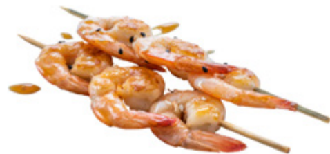
187 · EBI NO KUSHIYAKI € 9,00 Spiedini di gamberetti alla griglia con sesamo e salsa teriyaki 6 PEZZI allergeni: 1-2-6-11