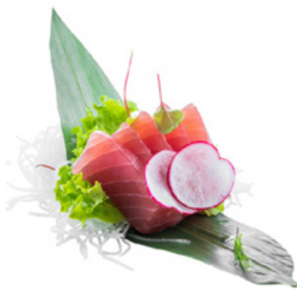
146 · SASHIMI TONNO € 12,00

Fettine di salmone crudo 10 PEZZI allergeni: 4