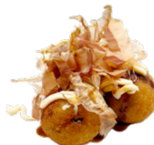
159 · TAKOYAKI | € 8,00

Tempura di gamberi 4 PEZZI allergeni: 1-2