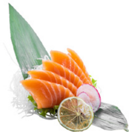
145 · SASHIMI SALMONE € 12,00

Salmone tagliato sottile condito con salsa ponzu 12 PEZZI allergeni: 1-4-6-11