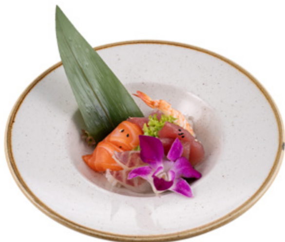
91 · CHIRASHI MIX | € 14,00 Fettine di pesce misto su letto di riso con sesamo allergeni: 2-4-11