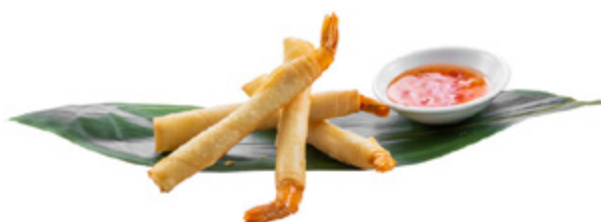
161 · EBI STICK | € 6,00

Polpette fritte di polipo e patate con maionese, salsa teriyaki e katsoubushi 4 PEZZI allergeni: 1-3-4-6-7-10-14