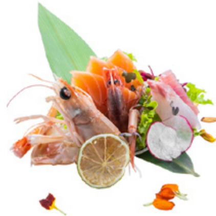
147 · SASHIMI MIX | € 16,00

Fettine di tonno crudo 6 PEZZI allergeni: 4