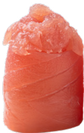
117 · GIO SPICY TUNA | € 4,50 🌶️ Bocconcini di riso avvolti con tonno, guarniti con tartare di tonno condita con salsa speziata 4 PEZZI allergeni: 4