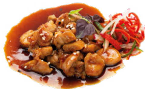
192 · YAKITORI | € 8,00 Pollo alla griglia con sesamo salsa teriyaki e porro allergeni: 1-6-11-14