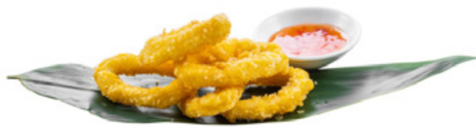
162 · IKA KARAGA | € 8,00

Involentino croccante di gambero fritto con salsa speciale 4 PEZZI allergeni: 1-2-3-7