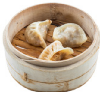
23 · RAVIOLI NIKU | € 5,50 Ravioli con carne e verdure 4 PEZZI allergeni: 1-2-3-4-6-8-9-10- 12-14