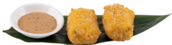
04 · CROCCHETTE DI SALMONE | € 5,00 Polpette croccanti di salmone e patate 4 PEZZI allergeni: 1-3-4-6-7