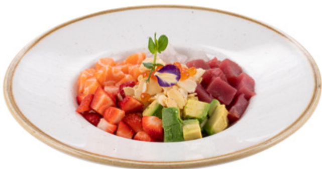
92 · POKE | € 14,00 Bocconcini di pesce misto su letto di riso con avocado, frutta di stagione, mandorle, ikura e tobiko* allergeni: 1-3-4-6-8