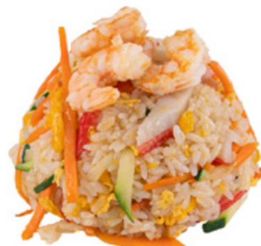
167 · KAISEN GOHAN | € 6,50 Riso saltato con frutti di mare, verdure miste e uova allergeni: 1-2-3-4-6-14