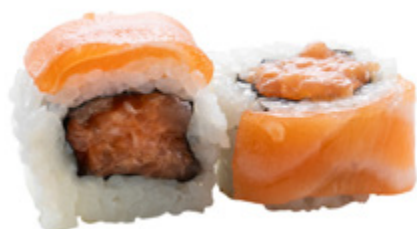
65 · JINO ROLL | € 13,00 🌶️ Roll di riso farcito con tartare di salmone, guarnito con fettine di salmone e salsa teriyaki tobiko* 8 PEZZI allergeni: 1-3-4-6-10