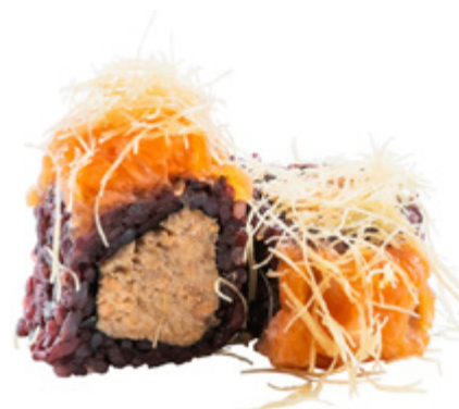
79 · MIURA PLUS | € 12,00 🍣 Roll di riso venere farcito con salmone cotto e Philadelphia, guarnito con tartare di salmone, kataifi e salsa teriyaki tobiko* 8 PEZZI allergeni: 1-3-4-6-7-10