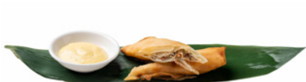
03 · INVOLTINO DI SALMONE | € 4,00 Sfoglia di salmone e mozzarella 3 PEZZI allergeni: 1-3-4-6-7-9