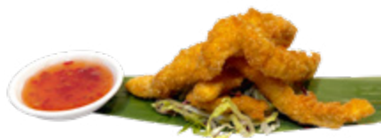
155 · TORIKARAGE € 6,00

Bocconcini di pollo fritti allergeni: 1-3-6-11