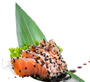
189 · SAKE TATAKI | € 9,00 Salmone scottato con sesamo e salsa teriyaki 8 PEZZI allergeni: 1-4-6-11