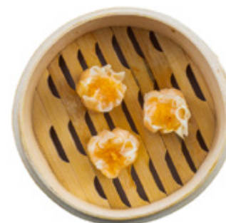
24 · RAVIOLI SHUMAY € 6,00 Ravioli con gamberi, carne, verdure e lardo 4 PEZZI allergeni: 1-2-3-4-6-9-11-12-14