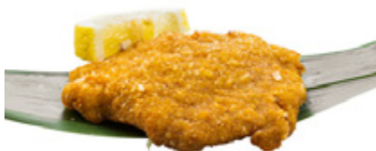
156 · COTOLETTA DI MAIALE | € 7,00

Bocconcini di pollo fritti allergeni: 1-3-6-11