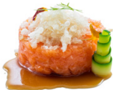
140 · SAKE TARTARE € 12,50

IN QUESTA PAGINA MAX 2 PIATTI PER BOX EASY / MAX 4 PIATTI PER BOX FAMILY