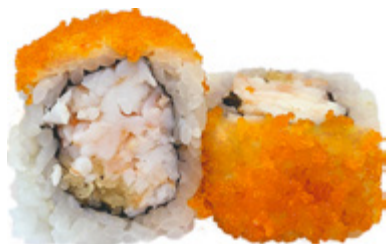
62 · YONG ROLL | € 9,00 Roll di riso farcito con gambero cotto e granella di tempura, guarnito con tobiko* e condito con salsa teriyaki 8 PEZZI allergeni: 1-2-4-6