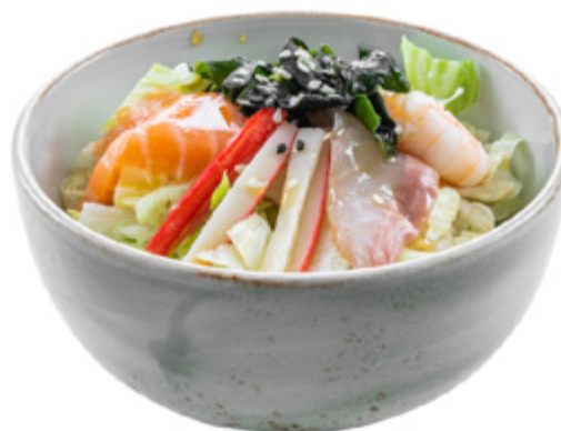
33 · GYOKAI SALAD | € 9,00 Insalata di mare con pesce misto crudo, sesamo e alghe allergeni: 1-2-4-6-11