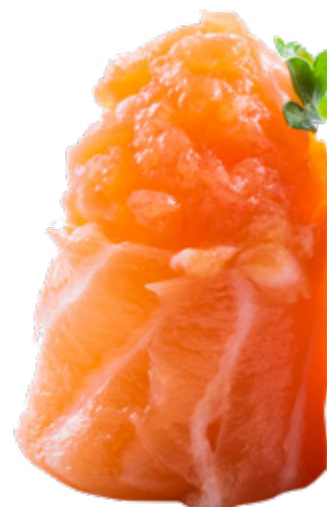
116 · GIO SPICY SALMON | € 4,50 🌶️ Bocconcini di riso avvolti con salmone, guarniti con tartare di salmone condita con salsa speziata e tobiko* 4 PEZZI allergeni: 1-3-4-6-10