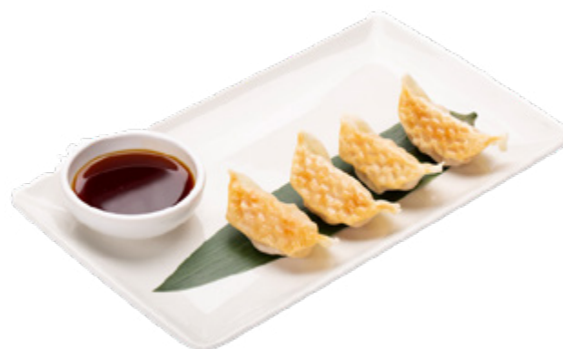
26 · EBI GYOZA GRILL € 6,50 Ravioli alla griglia con gamberi e verdure 4 PEZZI allergeni: 1-2-3-6-7-8