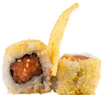
63 · TACOS ROLL | € 10,00 🌶️ Roll di riso farcito con tartare di salmone, guarnito con nachos e spicy mayo 8 PEZZI allergeni: 1-3-4-6-10