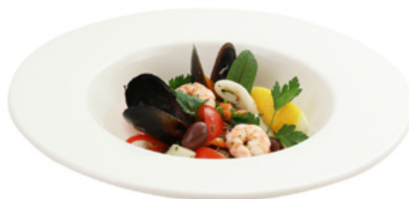
13 · INSALATA DI MARE | € 9,00 Misto di frutti di mare allergeni: 1-2-4-11-14