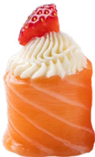
115 · GIO TROPICAL | € 4,50 Bocconcini di riso avvolti con salmone, guarniti con Philadelphia e frutta di stagione 4 PEZZI allergeni: 4-7