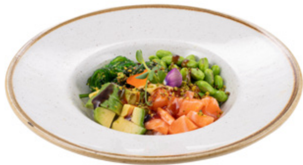
93 · POKE SALMON | € 14,00 Bocconcini di salmone su letto di riso con edamame, avocado, pistacchio, goma wakame, mayo e salsa teriyaki allergeni: 1-3-4-6-8-10-11