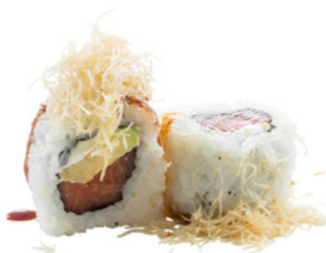
64 · FEVER | € 9,00 Roll di riso farcito con salmone, avocado e Philadelphia, guarnito con kataifi e salsa teriyaki 8 PEZZI allergeni: 1-4-6-7-11