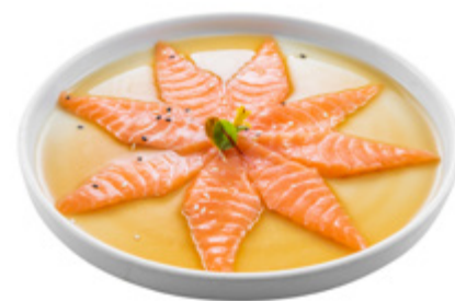
142 · CARPACCIO DI SALMONE | € 11,00

Tartare di avocado, kataifi, sesamo dressing allergeni: 1-3-6-11