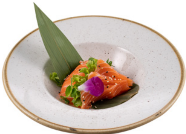
90 · CHIRASHI SAKEDON | € 14,00 Fettine di salmone su letto di riso con sesamo allergeni: 4-11