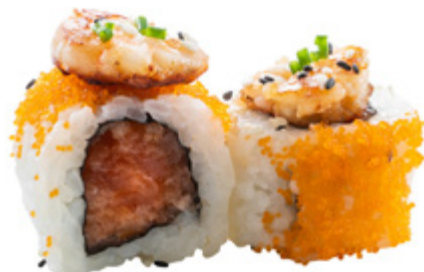
74 · FUSION ROLL | € 12,00 🍣 Roll di riso farcito con tartare di salmone, tobiko* , guarnito con gamberi alla griglia, erba cipollina, salsa teriyaki e sesamo 8 PEZZI allergeni: 1-2-3-4-6-10-11