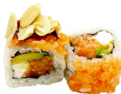
82 · ROLL SALMON PHILADELPHIA | € 13,00 🌶 Roll di riso farcito con salmone e Philadelphia, guarnito con tartare di salmone, scaglie di mandorle e tobiko* 8 PEZZI allergeni: 1-3-4-6-7-8-10