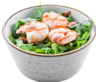
11 · COCKTAIL DI GAMBERETTI | € 6,00 Gamberetti con salsa rosa 8 PEZZI allergeni: 1-2-3-4-6-10