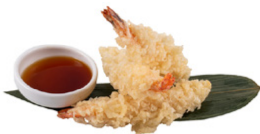
158 · EBI TEMPURA € 12,00

Frittura di chele di granchio impanate 4 PEZZI allergeni: 1-2-3-4-6