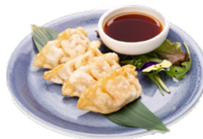
22 · GYOZA POLLO FRITTO € 5,50 Ravioli giapponesi fritti con pollo e verdure 4 PEZZI allergeni: 1-3-6-7-8