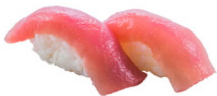
96 · MAGURO | € 4,00 Bocconcini di riso con tonno 6 PEZZI allergeni: 4