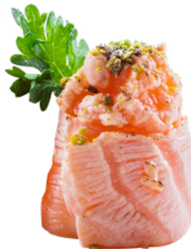
120 · GUNKAN PISTACCHIO | € 5,00 🌶️ Bocconcini di riso avvolti con salmone scottato, guarniti con tartare di salmone, salsa teriyaki, pistacchio e tobiko* 4 PEZZI allergeni: 1-3-4-6-8-10