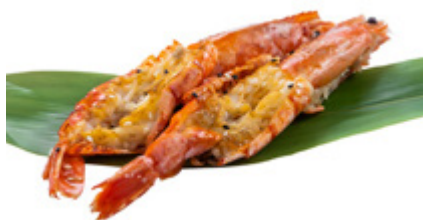
185 · EBI YAKI | € 10,00 Gamberoni alla griglia con sesamo e salsa teriyaki 4 PEZZI allergeni: 1-2-6-11