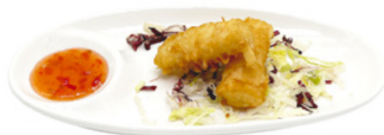
02 · HARUMAKI THAI | € 5,00 Involtino di pasta sfoglia con gamberi e lardo 4 PEZZI allergeni: 1-2-3-7-14