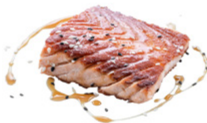
186 · SAKE YAKI | € 9,00 Salmone alla griglia con sesamo e salsa teriyaki 2 PEZZI allergeni: 1-4-6-11