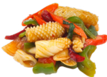
219 · SEPIE PICCANTI € 8,00 🌶️ Seppie saltate con salsa piccante e verdure miste allergeni: 1-6-14