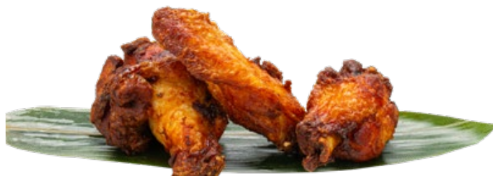
186 · ALETTE DI POLLO FRITTE | € 7,00 🌶️ Alette di pollo piccanti fritte 4 PEZZI allergeni: 1-3-7