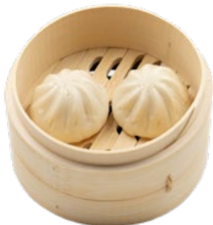
39 · XIAOLONGBAO | € 5,50 Pane orientale farcito con carne di maiale, lardo, cavolo cappuccio, erba cipollina e cipolla 4 PEZZI allergeni: 1-6-7-9-11-14