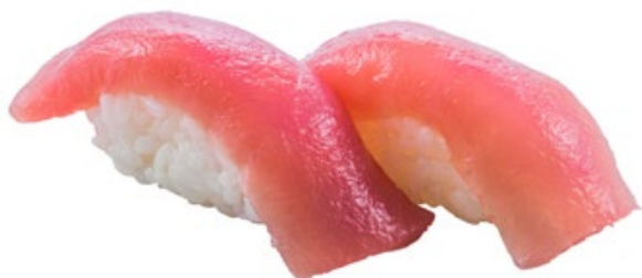
121 · MAGURO | € 4,00 Bocconcini di riso con tonno pinna gialla 6 PEZZI allergeni: 4