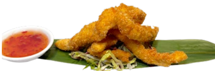
185 · TORIKARAGE | € 6,00 Bocconcini di pollo fritti allergeni: 1-3-6-7-11