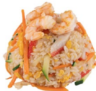
204 · KAISEN GOHAN | € 6,50 Riso saltato con frutti di mare, verdure miste e uova allergeni: 1-2-3-4-6-14