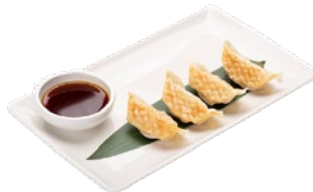
37 · EBI GYOZA GRILL € 6,50 Ravioli alla griglia con gamberi e verdure 4 PEZZI allergeni: 1-2-3-4-5-6-7-9-11- 12-14