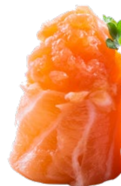
145 · GIO SPICY SALMON € 4,50 🌶️

Bocconcini di riso avvolti con salmone, guarniti con tartare di salmone condita con salsa speziata e