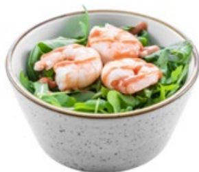
14 · COCKTAIL DI GAMBERETTI | € 6,00 Gamberetti con salsa rosa 8 PEZZI allergeni: 1-2-3-4-6-10