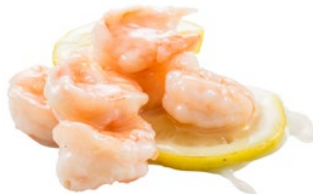
270 · GAMBERETTI AL LIMONE | € 9,00 Gamberetti in salsa al limone allergeni: 2-3