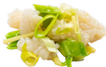
277 · SEPIE ZENZERO E PORRI | € 8,00

Bocconcini di branzino sale e pepe allergeni: 1-3-4