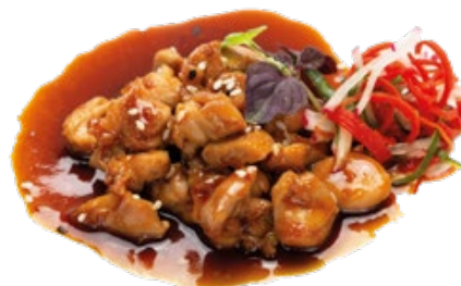
235 · YAKITORI | € 8,00 Pollo alla griglia con sesamo, salsa teriyaki e porro allergeni: 1-6-11-14