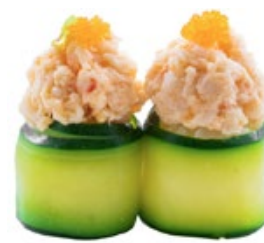
137 · ZUCCHINA | € 4,00 🌶️ Bocconcini di riso avvolti con zucchini e guarniti con tartare di gamberi e tobiko* 4 PEZZI allergeni: 1-2-3-4-6-10