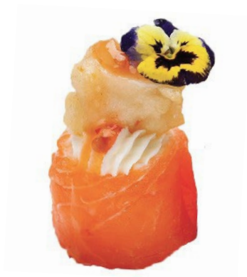
147 · GUNKAN SALMONE GAMBERO FRITTO SALSA AGROPICCANTE | € 5,00 🌶️

Bocconcini di riso avvolti con salmone, guarniti con Philadelphia, gamberi fritti e salsa agropiccante