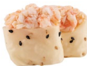
142 · SOY GAMBERO | € 4,00 🌶️ Bocconcini di riso avvolti con carta di soia con sesamo, guarniti con tartare di gambero e tobiko* 4 PEZZI allergeni: 1-2-3-4-6-10-11