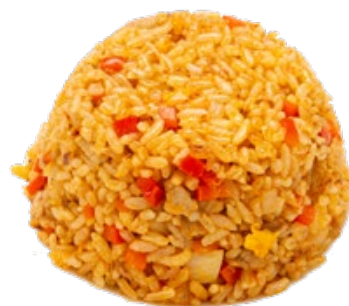
208 · RISO ALLA SALSA MIHO | € 6,50 Riso saltato alla salsa Miho con manzo, uova, peperoni e cipolla allergeni: 1-3-6-14