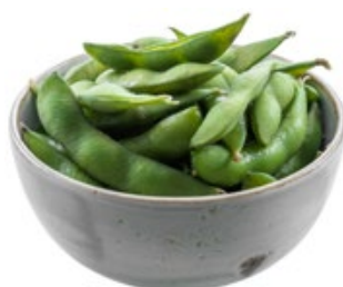
12 · EDAMAME | € 4,50 🌿 Baccelli di soia allergeni: 6