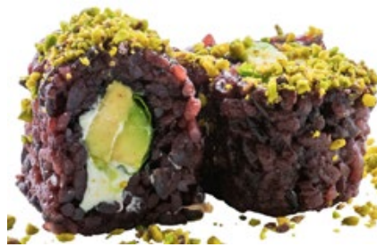
83 · JUST VEGETAL € 8,00 🌿 Roll di riso venere farcito con avocado, Philadelphia e insalata, guarnito con granella di pistacchio 8 PEZZI allergeni: 7-8