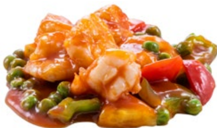
269 · GAMBERI AGRODOLCE | € 9,00 Gamberi in salsa agrodolce allergeni: 2-3-11-14