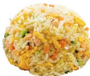
206 · RISO SALTATO CON SALMONE € 6,50 Riso saltato con salmone, verdure miste e uova allergeni: 1-3-4