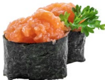
139 · SAKE | € 4,00 🌶️ Bocconcini di riso avvolti con alga nori, guarniti con tartare di salmone e tobiko* 4 PEZZI allergeni: 1-3-4-6-10