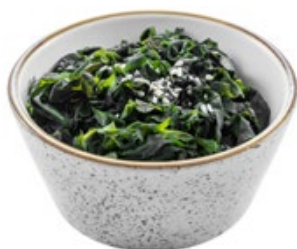
11 · WAKAME | € 4,50 🌿 Alghe con sesamo allergeni: 1-6-11