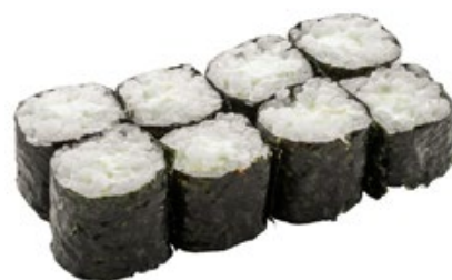
52 · HOSOMAKI PHILADELPHIA | € 4,00

Piccoli rotoli di riso avvolti con alga nori e farciti con avocado 8 PEZZI allergeni: /