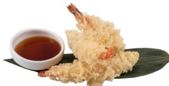
189 · EBI TEMPURA | € 12,00 Tempura di gamberi 4 PEZZI allergeni: 1-2