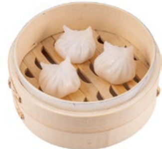
38 · GYOZA GAMBERO € 7,50 Ravioli di pasta di riso ripieni di gamberi 4 PEZZI allergeni: 1-2-6-9-11-14