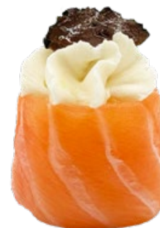
149 · GUNKAN CREMOSO E TARTUFO | € 5,00

Bocconcini di riso avvolti con salmone, guarniti con cream cheese e tartufo nero