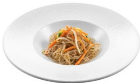
218 · SPAGHETTI DI SOIA VEGETARIANI € 5,50 🌿 Spaghetti di soia saltati con germogli di soia e verdure allergeni: 1-6-14