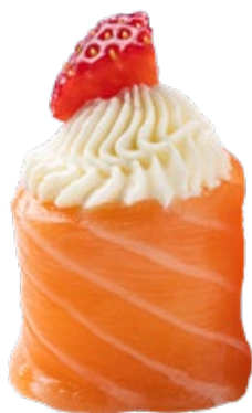
144 · GIO TROPICAL € 4,50

Bocconcini di riso avvolti con salmone, guarniti con Philadelphia e frutta di stagione