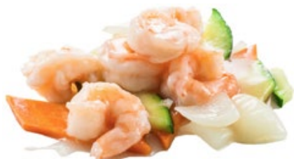
265 · GAMBERI AI CINQUE COLORI | € 8,00 Gamberi con cinque tipi di verdure allergeni: 2-3-9