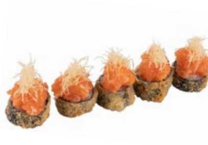
55 · HOSOMAKI SPICY SALMON | € 9,00

Piccoli rotoli di riso fritti avvolti con alga nori e farciti con Philadelphia e salmone, guarniti con frutta di stagione e salsa teriyaki 8 PEZZI allergeni: 1-3-4-6-7-11