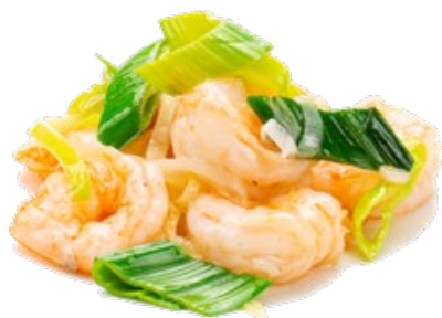
271 · GAMBERETTI ZENZERO E PORRI € 9,00

Gamberetti con zenzero e porri allergeni: 2-3-11-14