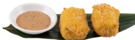
04 · CROCCHETTE DI SALMONE | € 5,00 Polpette croccanti di salmone e patate 4 PEZZI allergeni: 1-3-4-6-7