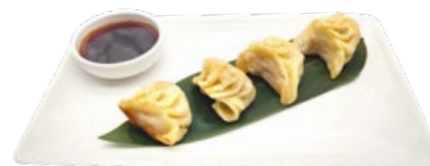
40 · RAVIOLI NIKU ALLA GRIGLIA | € 6,00 Raviolo con carne e verdure alla griglia 4 PEZZI allergeni: 1-2-3-4-6-8-9-10-12- 14