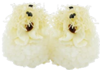
136 · WHITE TEMARI € 3,00 🌿 Bocconcini di riso guarniti con sesamo, Philadelphia, salsa teriyaki e kataifi 4 PEZZI allergeni: 1-6-7-11