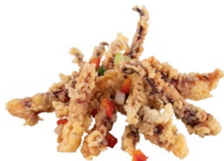
275 · CALAMARO SALE E PEPE | € 8,00 🌶️

Gamberetti con zenzero e porri allergeni: 2-3-11-14