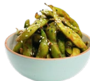
13 · EDAMAME SPICY | € 5,00 🌿🌶️ Baccelli di soia piccanti e semi di sesamo allergeni: 6-10-11