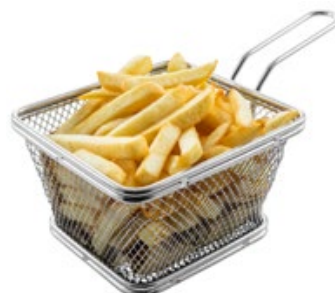
05 · PATATINE FRITTE € 3,50 🌿 Stick di patate allergeni: 1