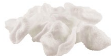
06 · NUVOLETTE DI DRAGO € 2,50 Croccanti chips di tapioca e frutti di mare allergeni: 1-2