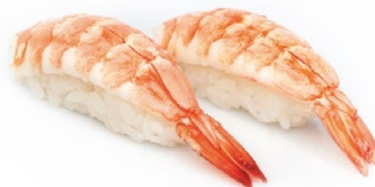
124 · EBI | € 3,50 Bocconcini di riso con gambero cotto 6 PEZZI allergeni: 2