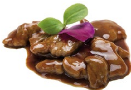
246 · MANZO SALTATO CON SALSA DI OSTRICHE | € 6,50 Bocconcini di manzo saltati con salsa di ostriche allergeni: 1-3-6-14