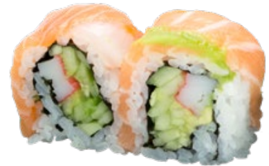
79 · RAINBOW ROLL | € 9,00 Roll di riso farcito con surimi, avocado e cetriolo, guarnito con pesce misto 8 PEZZI allergeni: 1-2-3-4-6-10