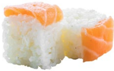
80 · SPECIAL ROLL | € 8,00 Roll di riso farcito con Philadelphia, guarnito con salmone e salsa teriyaki 8 PEZZI allergeni: 1-4-6-7-11