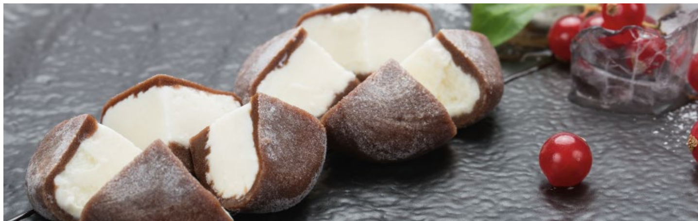
Mochi - Tipico dolce giapponese di riso glutinoso farcito con gelato