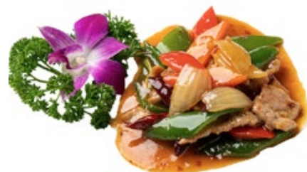
247 · MANZO PICCANTE € 6,50 🌶️🌶️ Bocconcini di manzo saltati con peperoncino ed erba cipollina allergeni: 1-3-6-14