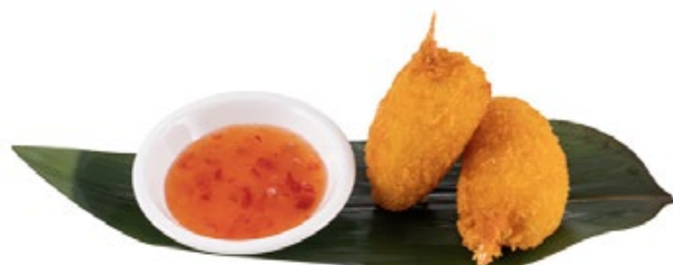
188 · CHELE DI GRANCHIO | € 6,00 Frittura di chele di surimi impanate 4 PEZZI allergeni: 1-2-3-4-6