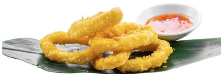
198 · IKA KARAGA | € 8,00 Frittura di anelli di calamaro 8 PEZZI allergeni: 1-3-14