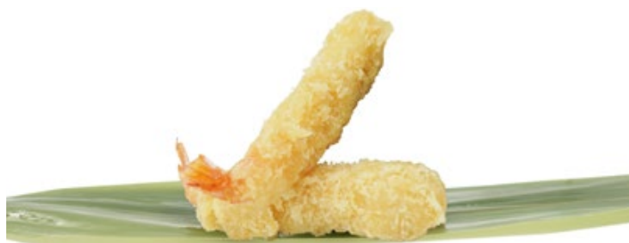
194 · GAMBERI PANKO € 8,00 Frittura di gamberi con panatura al Panko 4 PEZZI allergeni: 1-4-6