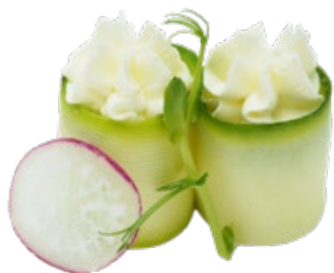
135 · TEMARI ZUCCHINA € 3,00 🌿 Bocconcini di riso avvolti con zucchini e guarniti con Philadelphia 4 PEZZI allergeni: 7