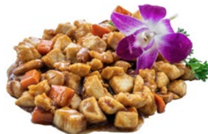
252 · POLLO ALLE MANDORLE | € 6,50 Petto di pollo saltato con mandorle e carote allergeni: 1-3-6-8-14