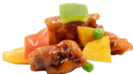
241 · BOCCONCINI DI MAIALE IN AGRODOLCE | € 6,50 Bocconcini di maiale in salsa agrodolce allergeni: 1-3