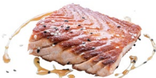
229 · SAKE YAKI | € 9,00 Salmone alla griglia con sesamo e salsa teriyaki 2 PEZZI allergeni: 1-4-6-11