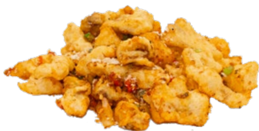
276 · BRANZINO SALE E PEPE | € 9,00 🌶️

Ciuffi di calamaro sale e pepe allergeni: 1-3-14