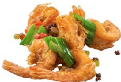
267 · GAMBERI SALE E PEPE | € 8,00 🌶️ Gamberi saltati con verdure allergeni: 1-2-3