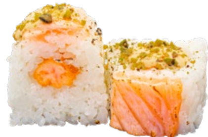
81 · FANCY SPECIAL ROLL | € 10,00 Roll di riso farcito con tempura di gambero, guarnito con salmone alla fiamma, salsa mayo-soia e granella di pistacchio 8 PEZZI allergeni: 1-2-3-4-6-8