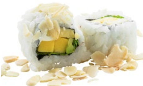
82 · VEGGIE ROLL | € 7,50 🌿 Roll di riso farcito con mango, avocado, Philadelphia e insalata, guarnito con scaglie di mandorle 8 PEZZI allergeni: 7-8