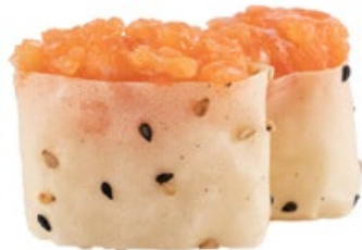
141 · SOY SALMON | € 3,50 🌶️ Bocconcini di riso avvolti con carta di soia con sesamo, guarniti con tartare di salmone e tobiko 4 PEZZI* allergeni: 1-3-4-6-10-11