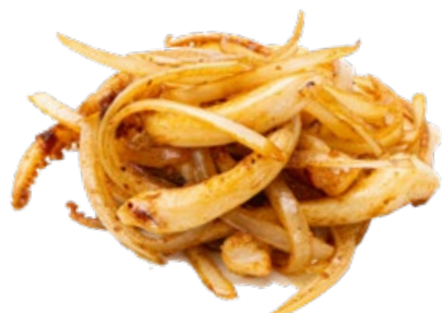
225 · CALAMARI ALLA GRIGLIA | € 9,00 Ciuffetti di calamari e cipolla alla griglia allergeni: 14