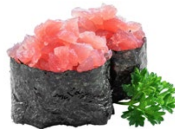
140 · MAGURO | € 4,50 Bocconcini di riso avvolti con alga nori, guarniti con tartare di tonno pinna gialla 4 PEZZI allergeni: 4