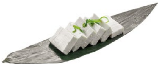
09 · TOFU | € 3,00 🌿 Tofu con salsa di soia allergeni: 1-6