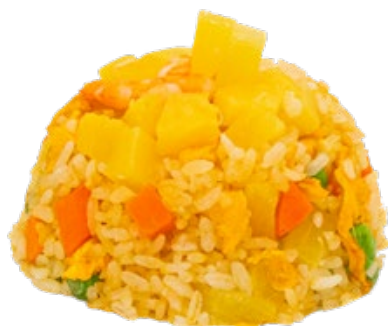
207 · RISO SALTATO CON ANANAS | € 6,50 Riso saltato con gambero, ananas, anacardi, verdure miste e uova allergeni: 1-2-3-6-8