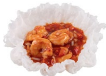
266 · GAMBERETTI THAI | € 8,00 🌶️ Gamberetti alla thailandese allergeni: 1-2-3-6