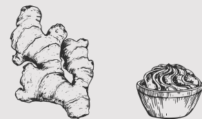
ZENZERO E WASABI