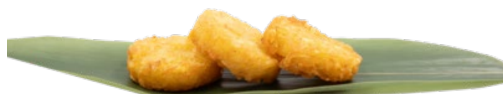
08 · MEDAGLIONE DI PATATE | € 3,50 Medaglioni di patate fritti allergeni: 1-3-6-7-9-13