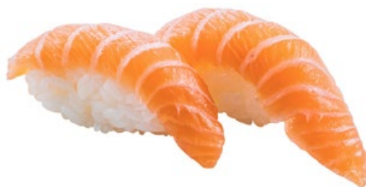
120 · SAKÉ | € 3,50 Bocconcini di riso con salmone 6 PEZZI allergeni: 4