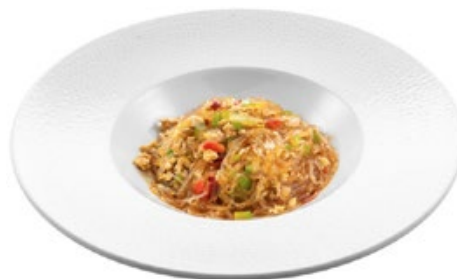
219 · SPAGHETTI DI SOIA PICCANTI € 6,00 🌶️ Spaghetti di soia saltati con pollo e peperoni allergeni: 1-6-14