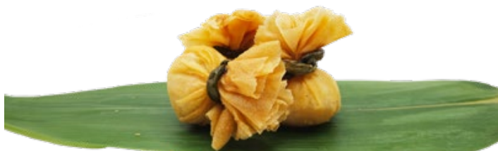
193 · EBI BAG | € 8,00 Bocconcini croccanti di gamberi e verdure 4 PEZZI allergeni: 1-2-6