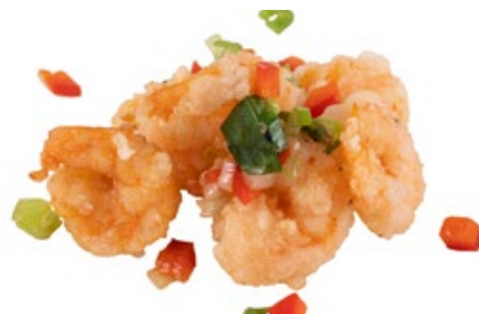
268 · GAMBERETTI DELLO CHEF | € 8,00 🌶️ Gamberetti sgusciati croccanti allergeni: 1-2-3