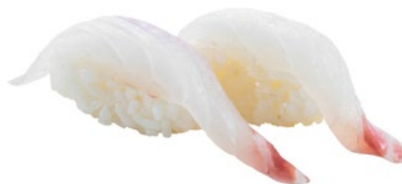
122 · TAI | € 3,50 Bocconcini di riso con branzino 6 PEZZI allergeni: 4