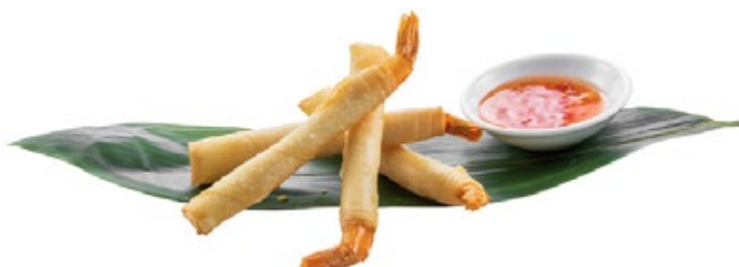
195 · EBI STICK | € 7,00 Involtino croccante di gambero fritto con salsa speciale 4 PEZZI allergeni: 1-2-3-7