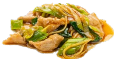
245 · MANZO ZENZERO E PORRI | € 7,00 Bocconcini di manzo saltati con zenzero e porri allergeni: 1-3-6-11-14