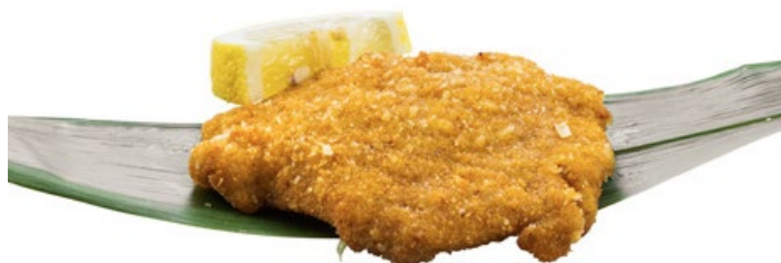
187 · COTOLETTA DI MAIALE € 7,00 Cotoletta di maiale impanata allergeni: 1-3-6-11