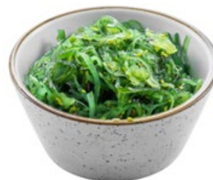
10 · GOMA WAKAME | € 4,50 🌿🌶️ Alghe agropiccanti allergeni: 1-6-11