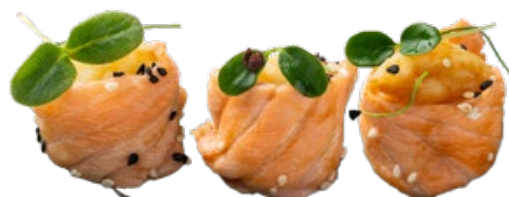
227 · SAKE IMOYAKI | € 7,00 Salmone arrotolato con sesamo, purea di patate e salsa imoyaki 5 PEZZI allergeni: 1-3-4-6-7-11