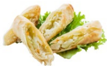
01 · HARUMAKI | € 3,50 🌿 Involtino di pasta sfoglia alle verdure 3 PEZZI allergeni: 1-3-7