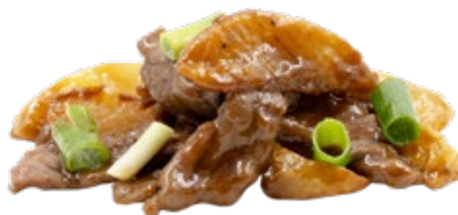
249 · MANZO CON PATATE € 7,00 Bocconcini di manzo saltati con patate allergeni: 1-3-6-11-14