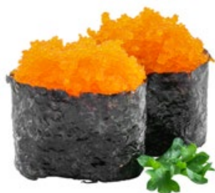
138 · TOBIKO | € 5,00 Bocconcini di riso avvolti con alga nori e ripieni di tobiko* 4 PEZZI allergeni: 1-4-6