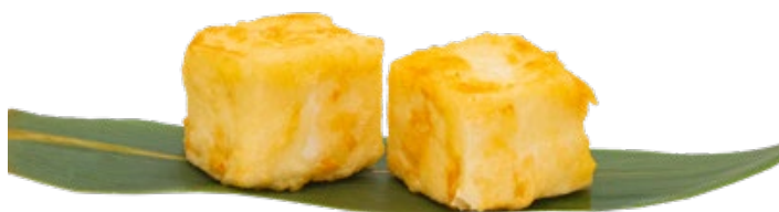
199 · TOFU TEMPURA | € 6,00 Tofu in tempura 8 PEZZI allergeni: 1-2-6