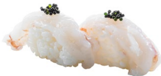
123 · AMAEBI | € 4,00 Bocconcini di riso con gambero crudo e tobiko* 6 PEZZI allergeni: 1-2-4-6