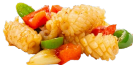
279 · SEPIE AGROPICCANTI | € 8,00 🌶️

Seppie croccanti con sale e pepe allergeni: 1-14