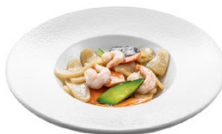
222 · GNOCCHI DI RISO E GAMBERI € 7,00 Gnocchi di riso saltati con gamberi, verdure e funghi* allergeni: 1-2-6-14