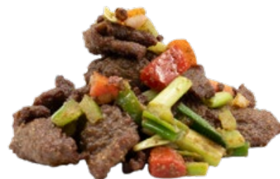
244 · MANZO AL CUMINO € 7,00 Bocconcini di manzo saltati con verdure e cumino allergeni: 1-3-6-11-14