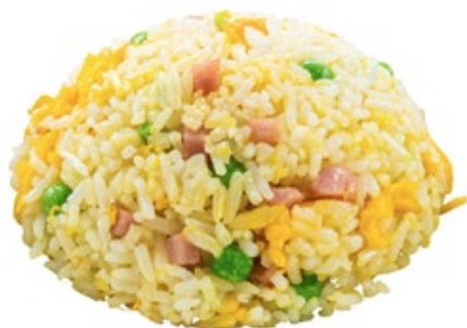
205 · RISO ALLA CANTONESE | € 4,50 Riso saltato con piselli, prosciutto cotto e uova allergeni: 1-3