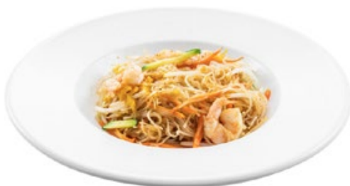
221 · SPAGHETTI DI RISO IMPERIALI € 6,50 Spaghetti di riso saltati con gamberetti, verdure e uova allergeni: 1-2-3-6-14