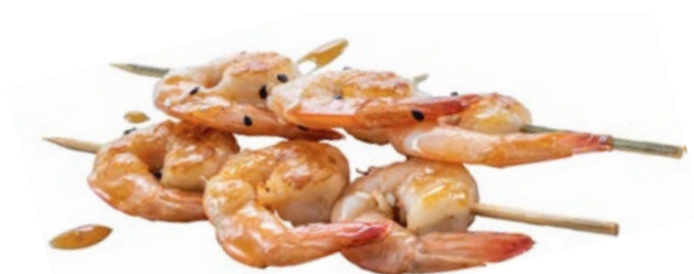
231 · EBI NO KUSHIYAKI | € 9,00 Spiedini di gamberetti alla griglia con sesamo e salsa teriyaki 6 PEZZI allergeni: 1-2-6-11