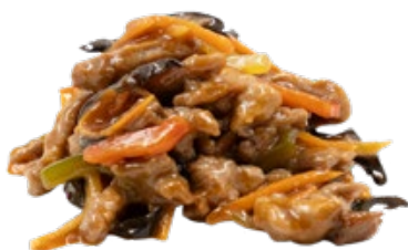
240 · BOCCONCINI DI MAIALE IN SALSA AGROPICCANTE E PEPE DI SICHUAN | € 6,50 🌶️ Bocconcini di maiale saltati con verdure, peperoncino ed erba cipollina allergeni: 1-3-6-11-14