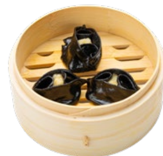
41 · RAVIOLI AL NERO DI SEPPIA | € 7,50 Ravioli al nero di seppia con ripieno di calamaro 4 PEZZI allergeni: 1-2-4-6-7-9-10-11-14