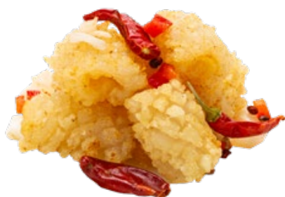
278 · SEPIE SALE E PEPE | € 8,00 🌶️

Seppie saltate con zenzero e porri allergeni: 11-14