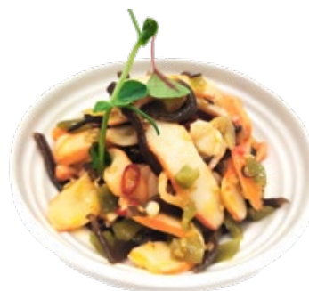
16 · IKA INSALATA | € 6,00 🌶️ Tipica insalata giapponese con totano allergeni: 4-6-11-14