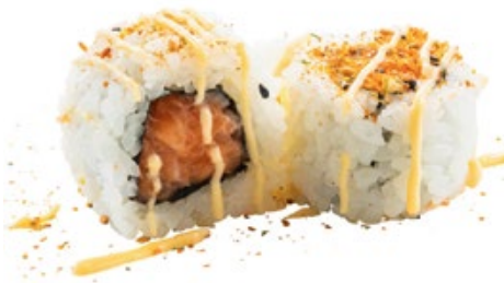
77 · SPICY SAKE | € 8,00 🌶️ Roll di riso farcito con tartare di salmone e cetriolo, guarnito con shichimi, salsa piccante e tobiko* 8 PEZZI allergeni: 1-3-4-6-10-11