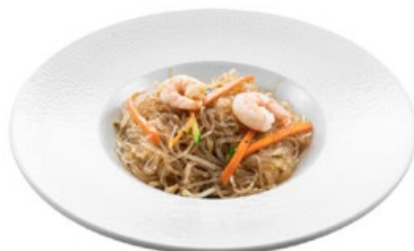
220 · SPAGHETTI DI SOIA CON GAMBERI € 6,50 Spaghetti di soia saltati con gamberi, germogli di soia e verdure allergeni: 1-2-6-14