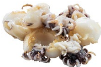
232 · SEPPIOLINE ALLA GRIGLIA | € 9,00 Seppie alla griglia allergeni: 14