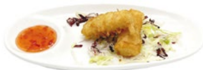
02 · HARUMAKI THAI | € 5,00 Involtino di pasta sfoglia con gamberi e lardo 4 PEZZI allergeni: 1-2-3-7-14