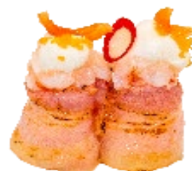
143 · BACON | € 4,50 🌶️ Bocconcini di riso avvolti con bacon scottato alla fiamma, guarniti con crema di burrata, amaebi, pomodoro e tobiko* 4 PEZZI allergeni: 1-2-4-6-7