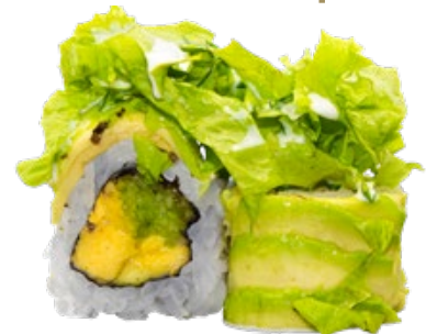
84 · GREEN DAY | € 7,50 🌿 Roll di riso farcito con cetriolo e avocado, guarnito con avocado a fette, insalata, salsa yogurt 8 PEZZI allergeni: 3-7