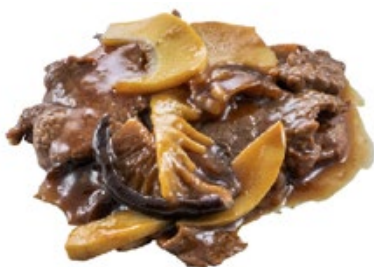
248 · MANZO CON FUNGHI E BAMBÙ | € 7,00 Bocconcini di manzo saltati con funghi* e bambù allergeni: 1-3-6-14