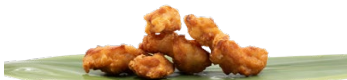
07 · STRACCETTI CROCCANTI | € 5,00 🌶️ Straccetti di maiale fritti al pepe di Sichuan allergeni: 1-2-3-4-5-6-9-11-12-14