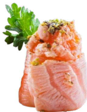
148 · GUNKAN PISTACCHIO € 5,00 🌶️

Bocconcini di riso avvolti con salmone scottato, guarniti con tartare di salmone, salsa teriyaki, pistacchio e tobiko*