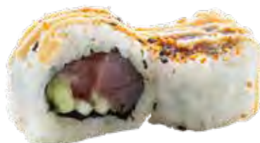
138 · SPICY MAGURO | € 9,0 🌶️ Roll di riso farcito con tonno, cetriolo, guarnito con shichimi e salsa piccante