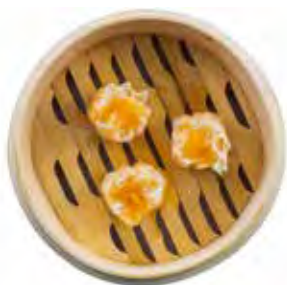
18 · RAVIOLI SHUMAY | € 6,00 Ravioli con gamberi, carne, verdure e lardo