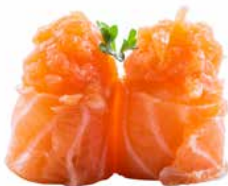
87 · GIO SPICY SALMON | € 4,50 🌶️ Bocconcini di riso avvolti con salmone, guarniti con tartare di salmone condita con salsa speziata