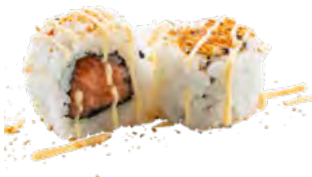
137 · SPICY SAKE | € 8,00 🌶️ Roll di riso farcito con tartare di salmone, cetriolo, guarnito con shichimi e salsa piccante