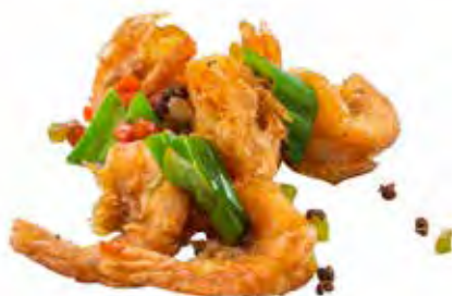
233 · GAMBERETTI SALE E PEPE | € 8,00 🌶️ Gamberetti saltati con verdure