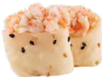
80 · SOY GAMBERO | € 4,00 🌶️ Bocconcini di riso avvolto con carta di soia con sesamo, guarniti con tartare di gambero