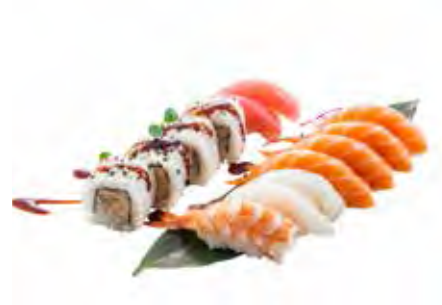
56 · SUSHI MIX | € 12,00 Sushi assortito (10 pz.)