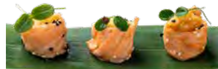
06 · SAKE IMOYAKI | € 6,00 Salmone arrotolato con sesamo, purea di patate e salsa imoyaki