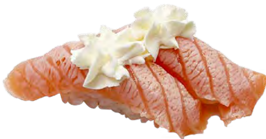
75 · SALMONE FLAMBÈ E PHILADELPHIA | € 4,00 Bocconcini di riso con salmone scottato, Philadelphia e salsa teriyaki