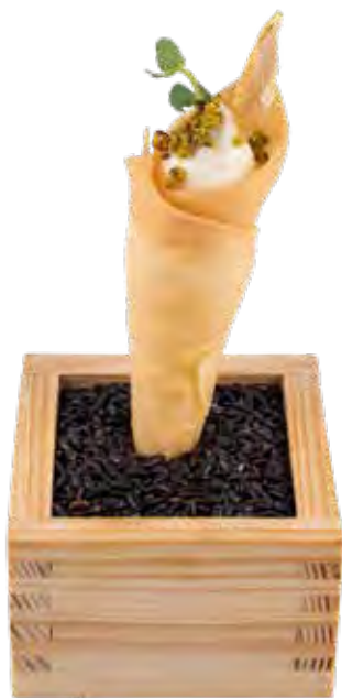
11 · MOUSSE SALMONE | € 6,00 Cono croccante di pasta sfoglia con mousse di salmone, Philadelphia, avocado e pistacchio allergeni: 1-4-6-7-8