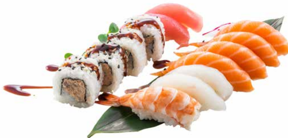
57 · SUSHI MIX | € 15,00 Sushi assortito (13 pz.)