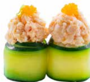
85 · ZUCCHINA | € 4,00 🌶️ Bocconcini di riso avvolti con zucchini tagliata sottile, guarniti con tartare di gamberi