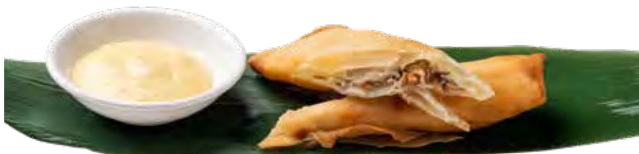
03 · INVOLTINO DI SALMONE | € 4,00 Sfoglia di salmone e mozzarella