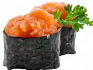
81 · SAKE | € 3,50 🌶️ Bocconcini di riso avvolti con alga nori, guarniti con tartare di salmone