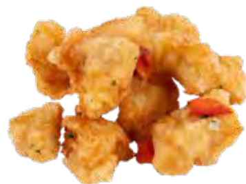
227 · POLLO SALE E PEPE | € 7,00 🌶️

Petto di pollo croccante con sale e pepe