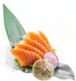
52 · SASHIMI SALMONE | € 12,00 Fettine di salmone crudo