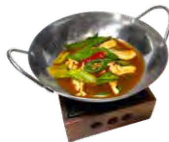
244 · ONABE POLLO | € 7,00 🌶️

Piatto tradizionale di carne di pollo e verdure, servito al tavolo nel wok con fornello