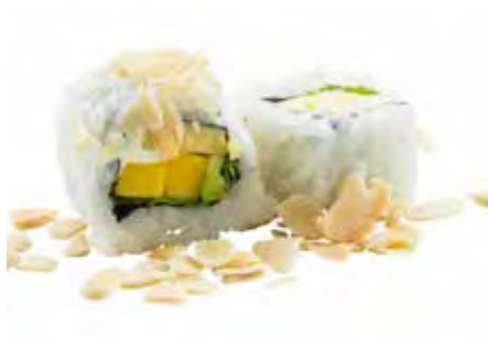
143 · VEGGIE ROLL | € 7,50 🌿 Roll di riso farcito con mango, avocado, Philadelphia e insalata, guarnito con scaglie di mandorle