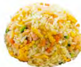
194 · RISO SALTATO CON SALMONE | € 6,00 Riso saltato con salmone, verdure miste e uova