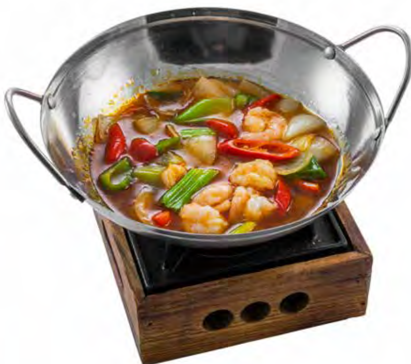
241 · ONABE GAMBERI | € 8,50 🌶️

Piatto tradizionale di gamberi e verdure, servito al tavolo nel WOK con fornello.