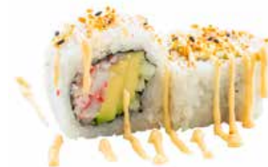
139 · SPICY CALIFORNIA | € 7,00 🌶️ Roll di riso farcito con granchio, avocado e cetriolo, guarnito con shichimi e salsa piccante