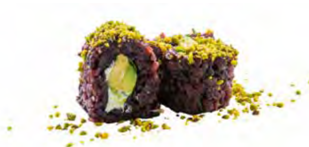
145 · JUST VEGETAL | € 8,00 🌿 Roll di riso venere farcito con avocado, Philadelphia e insalata, guarnito con granella di pistacchio