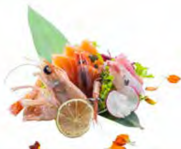
54 · SASHIMI MIX | € 16,00 Fettine di pesce misto e scampi