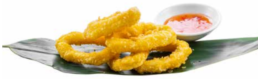
177 · IKA KARAGA | € 8,00 Frittura di calamaro impanato