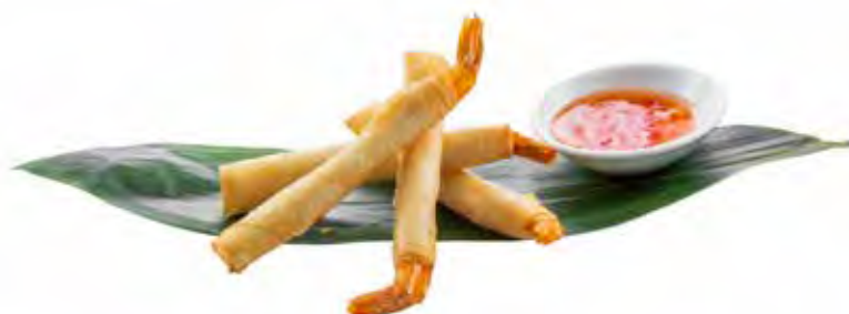
178 · EBI STICK | € 6,00 Involtino croccante di gambero fritto con salsa speciale