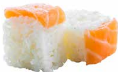
140 · SPECIAL ROLL | € 8,00 Roll di riso farcito con Philadelphia guarnito con salmone e salsa teriyaki