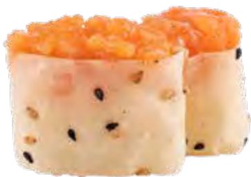
79 · SOY SALMON | € 3,50 🌶️ Bocconcini di riso avvolto con carta di soia con sesamo, guarniti con tartare di salmone