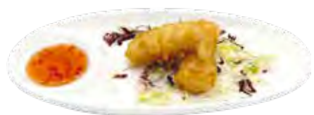
02 · HARUMAKI THAI | € 5,00 Involtino di pasta sfoglia con gamberi e lardo