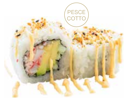
57 · SPICY CALIFORNIA | € 7,50 🌶️ Roll di riso farcito con granchio, avocado e cetriolo, guarnito con shichimi, salsa piccante e tobiko* allergeni: 1-2-3-4-6-10-11