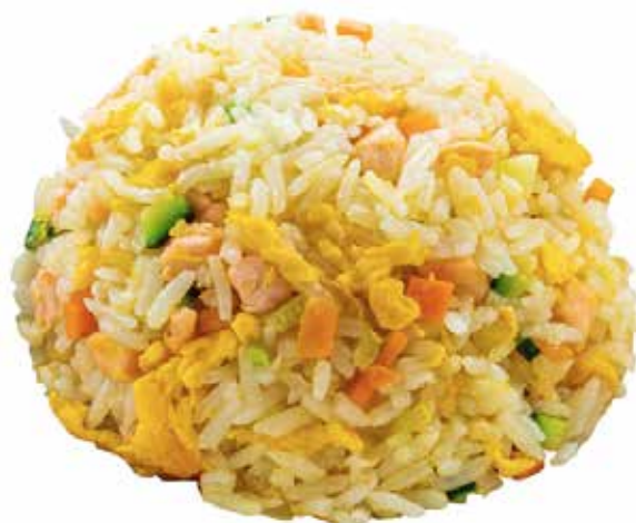
169 · RISO SALTATO CON SALMONE | € 6,50 Riso saltato con salmone, verdure miste e uova allergeni: 1-3-4