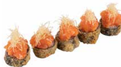
40 · HOSOMAKI SPICY SALMON | € 9,00

Piccoli rotoli di riso avvolti con alga nori, fritti e farciti con Philadelphia e salmone, guarniti con frutta di stagione e salsa teriyaki allergeni: 1-3-4-6-7