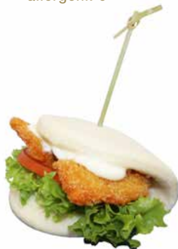
14 · GUABAO DI POLLO € 5,50 Pane orientale ripieno di pollo, lattuga, pomodoro e maionese allergeni: 1-3-6-7-10