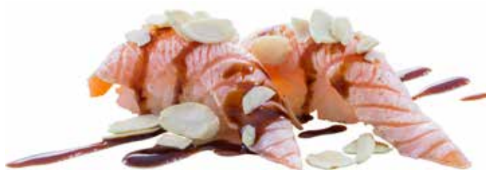
102 · NIGIRI MANDORLE | € 4,50

Bocconcini di riso con salmone scottato, pistacchi e salsa teriyaki allergeni: 1-4-6-8