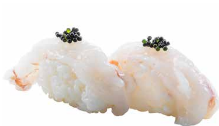
98 · AMAEBI | € 4,00 Bocconcini di riso con gambero crudo e tobiko* allergeni: 1-2-4-6