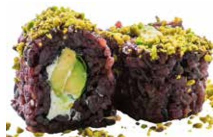
61 · JUST VEGETAL | € 8,00 🌿 Roll di riso venere farcito con avocado, Philadelphia e insalata, guarnito con granella di pistacchio allergeni: 7-8