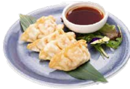
22 · GYOZA POLLO FRITTO € 5,50 Ravioli giapponesi fritti con pollo e verdure allergeni: 1-3-6-7-8