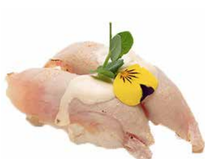
103 · TONNO CON SALSA TONNATA | € 5,00

Bocconcini di riso con salmone scottato, mandorle e salsa teriyaki allergeni: 1-4-6-8