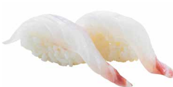
97 · TAI | € 3,50 Bocconcini di riso con branzino allergeni: 4