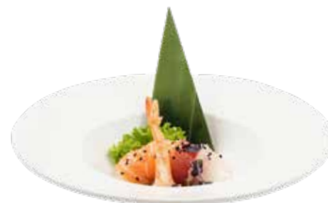
91 · CHIRASHI MIX | € 14,00 Fettine di pesce misto su letto di riso con sesamo allergeni: 2-4-11