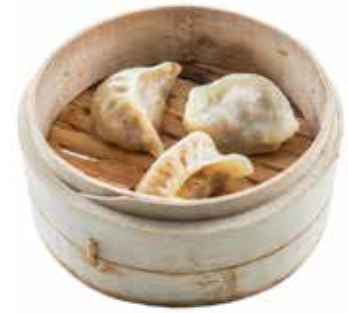
23 · RAVIOLI NIKU | € 5,50 Ravioli con carne e verdure allergeni: 1-2-3-4-6-8-9-10- 12-14