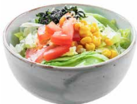
32 · YASAI SALAD | € 4,00 🌿 Insalata mista con alghe, mais, sesamo e pomodoro allergeni: 1-6-11