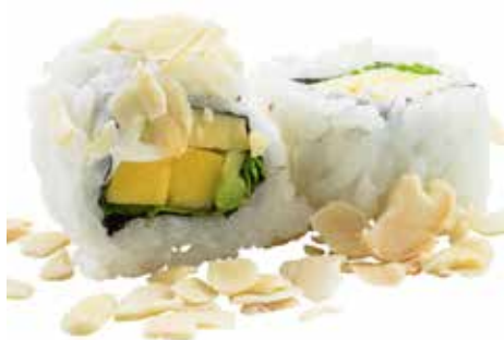
60 · VEGGIE ROLL | € 7,50 🌿 Roll di riso farcito con mango, avocado, Philadelphia e insalata, guarnito con scaglie di mandorle allergeni: 7-8