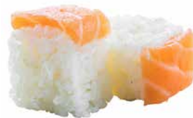
58 · SPECIAL ROLL | € 8,00 Roll di riso farcito con Philadelphia guarnito con salmone e salsa teriyaki allergeni: 1-4-6-7