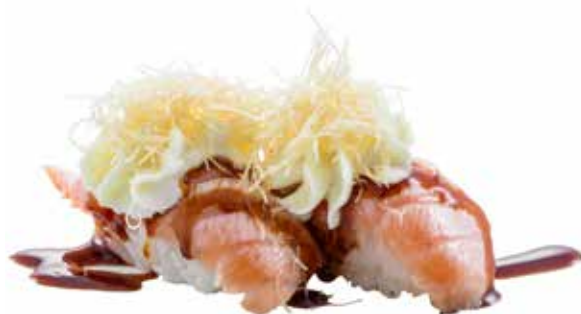
100 · SALMONE FLAMBÈ E PHILADELPHIA € 4,50

Bocconcini di riso con salmone scottato, Philadelphia e salsa teriyaki allergeni: 1-4-6-7