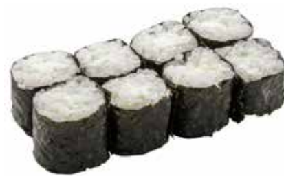
37 · HOSOMAKI PHILADELPHIA | € 4,00

Piccoli rotoli di riso avvolti con alga nori e farciti con avocado allergeni: /