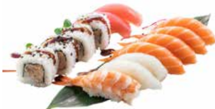
126 · SUSHI MIX | € 16,00 Sushi assortito (13 pezzi) tobiko* allergeni: 1-2-4-6-7-8-11