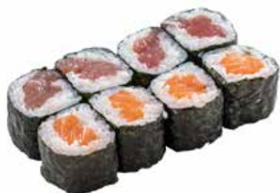
38 · HOSOMAKI MISTO € 5,50

Piccoli rotoli di riso avvolti con alga nori e farciti con Philadelphia allergeni: 7