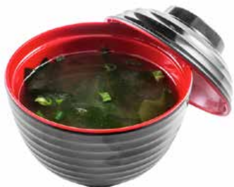
30 · ZUPPA DI MISO | € 3,00 Tradizionale zuppa a base di dashi e pasta di miso allergeni: 1-4-6