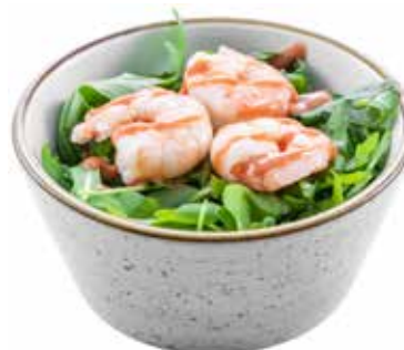
13 · COCKTAIL DI GAMBERETTI € 6,00 Gamberetti con salsa rosa allergeni: 1-2-3-4-6-10