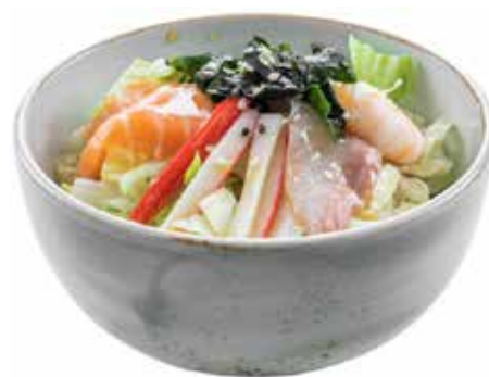
33 · GYOKAI SALAD | € 9,00 Insalata di mare con pesce misto crudo, sesamo e alghe allergeni: 1-2-4-6-11