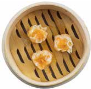
24 · RAVIOLI SHUMAY € 6,50 Ravioli con gamberi, carne, verdure e lardo allergeni: 1-2-3-4-6-9-11-12- 14