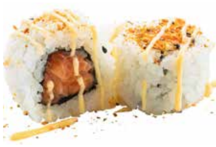
56 · SPICY SAKE | € 8,00 🌶️ Roll di riso farcito con tartare di salmone, cetriolo, guarnito con shichimi e salsa piccante allergeni: 1-3-4-6-10-11