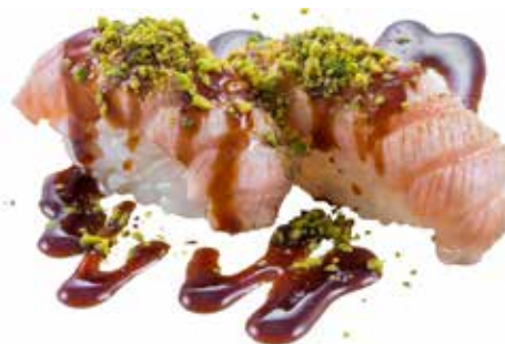
101 · SALMONE FLAMBÈ AL PISTACCHIO | € 4,50

Bocconcini di riso con salmone scottato, Philadelphia e salsa teriyaki allergeni: 1-4-6-7