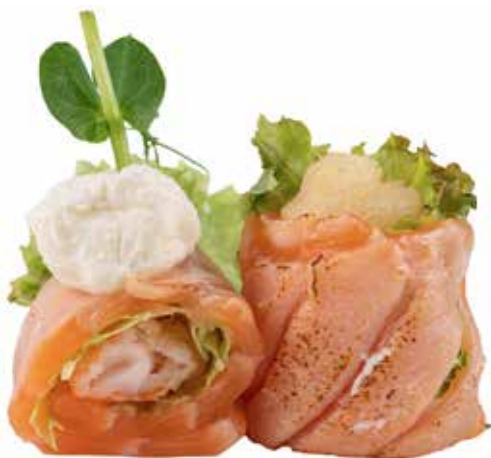
136 · NICETY EBI | € 8,00 Delicati bocconcini con tempura di gamberi, Philadelphia e insalata, avvolti con salmone scottato e conditi con salsa teriyaki allergeni: 1-2-4-6-7