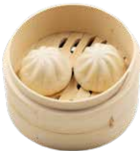
28 · XIAOLONGBAO | € 5,50 Pane orientale farcito con carne di maiale, lardo, cavolo cappuccio, erba cipollina e cipolla allergeni: 1-6-7-9-11-14