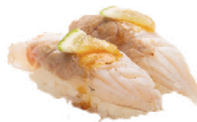
105 · BRANZINO LIME SUMISO | € 4,50

Bocconcini di riso, salmone scottato con crema al tartufo e ikura allergeni: 1-3-4-6-10