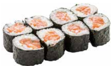
35 · HOSOMAKI SAKE € 5,00

Piccoli rotoli di riso avvolti con alga nori e farciti con salmone allergeni: 4