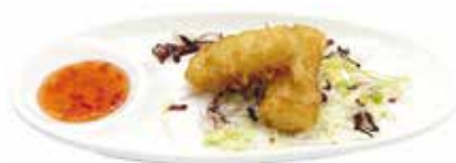
02 · HARUMAKI THAI | € 5,00 Involtino di pasta sfoglia con gamberi e lardo allergeni: 1-2-3-7-14