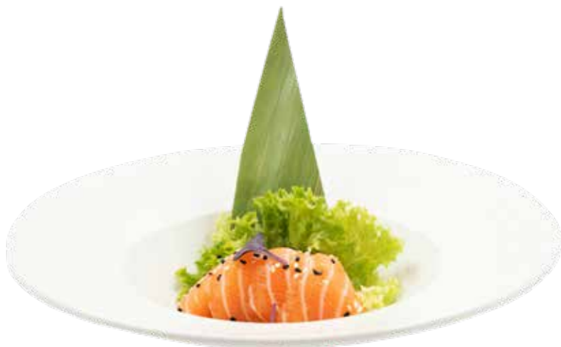
90 · CHIRASHI SAKEDON | € 14,00 Fettine di salmone su letto di riso con sesamo allergeni: 4-11