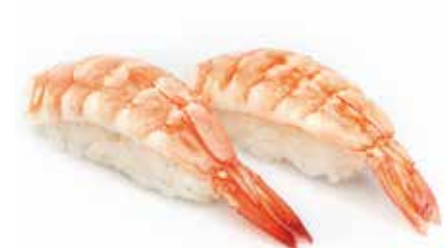
99 · EBI | € 3,50 Bocconcini di riso con gambero cotto allergeni: 2