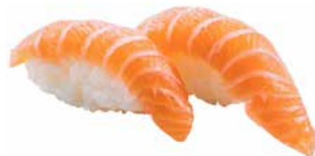
95 · SAKE | € 3,50 Bocconcini di riso con salmone allergeni: 4