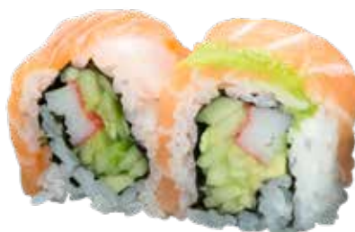
59 · RAINBOW ROLL | € 9,00 Roll di riso farcito con granchio, avocado e cetriolo, guarnito con pesce misto allergeni: 1-2-3-4-6-10