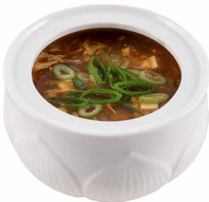
31 · ZUPPA AGROPICCANTE | € 4,00 🌶️ Zuppa di verdure con tofu, uovo, bambù e pollo allergeni: 1-3-6-14