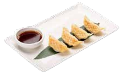
26 · EBI GYOZA GRILL € 6,50 Ravioli alla griglia con gamberi e verdure allergeni: 1-2-3-4-5-6-7-9- 11-12-14