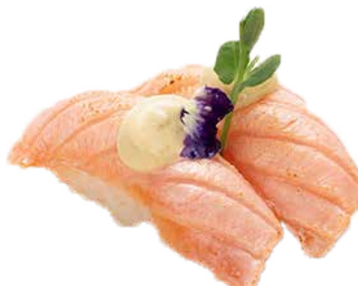
104 · SALMONE TARTUFO IKURA | € 4,50

Bocconcini di riso, tonno scottato, salsa tonnata allergeni: 1-3-4-6-10