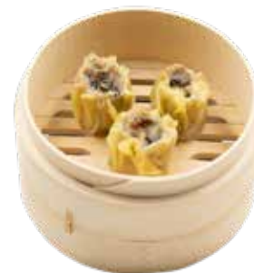
29 · POLLO SHUMAY | € 6,00 Ravioli con pollo, funghi, erba cipollina e cipolla allergeni: 1-6-9-11-14