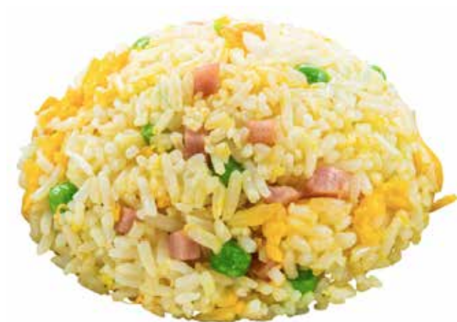
168 · RISO ALLA CANTONESE | € 4,50 Riso saltato con piselli, prosciutto cotto e uova allergeni: 1-3