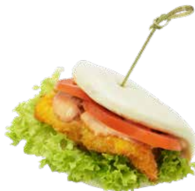
15 · GUABAO DI GAMBERO € 6,00 Pane orientale ripieno di gamberi, lattuga, pomodoro e salsa rosa allergeni: 1-2-3-4-6-7-10