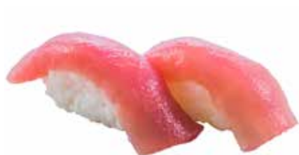
96 · MAGURO | € 4,00 Bocconcini di riso con tonno allergeni: 4