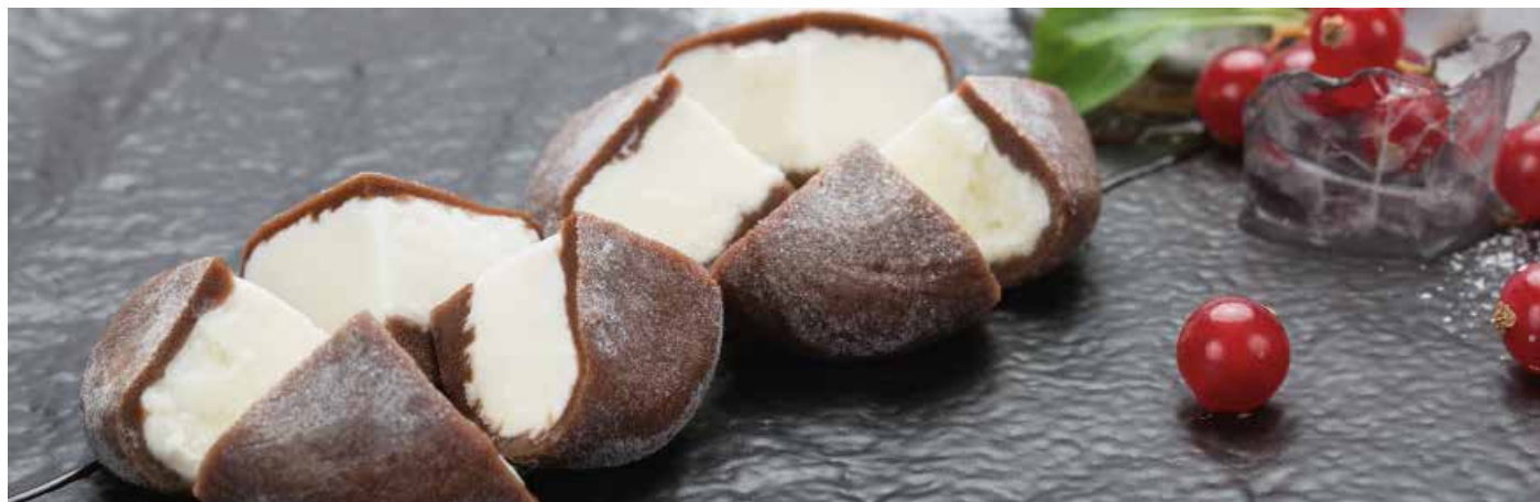
Mochi - Tipico dolce giapponese di riso glutinoso farcito con gelato