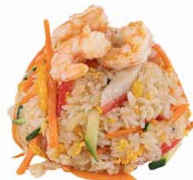
167 · KAISEN GOHAN € 6,50 Riso saltato con frutti di mare, verdure miste e uova allergeni: 1-2-3-4-6-14