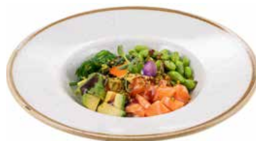
93 · POKE SALMON | € 14,00 Bocconcini di salmone su letto di riso con edamame, avocado, pistacchio, goma wakame, mayo e salsa teriyaki allergeni: 1-3-4-6-8-10-11