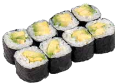
36 · HOSOMAKI AVOCADO € 3,50

Piccoli rotoli di riso avvolti con alga nori e farciti con salmone allergeni: 4