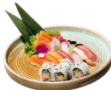
127 · SUSHI E SASHIMI MISTO | € 22,00 Sushi e sashimi assortiti (20 pezzi) allergeni: 1-2-4-6-7-11-14