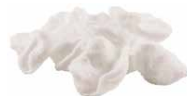
06 · NUVOLETTE DI DRAGO | € 2,50 Croccanti chips di tapioca e frutti di mare allergeni: 1-2