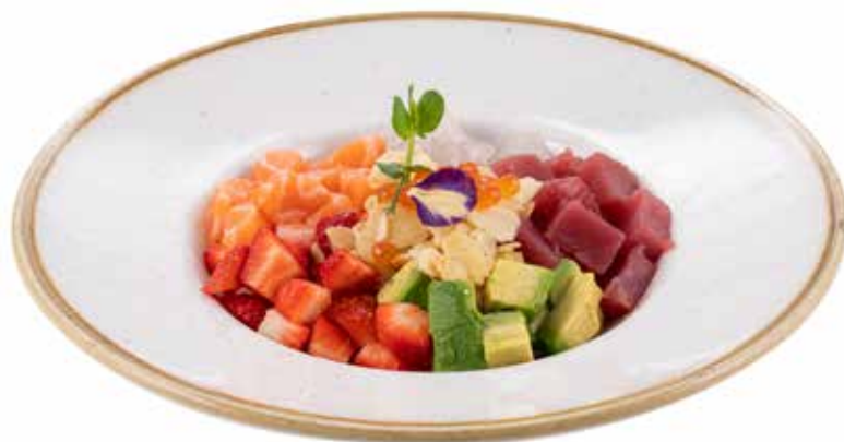
92 · POKE | € 14,00 Bocconcini di pesce misto su letto di riso con avocado, frutta di stagione, mandorle, ikura e tobiko* allergeni: 1-3-4-6-8