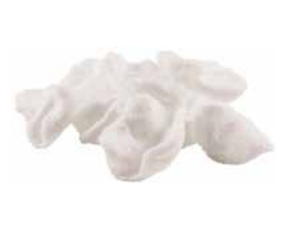
06 · NUVOLETTE DI DRAGO | € 2,50 Croccanti chips di tapioca e frutti di mare allergeni: 1-2