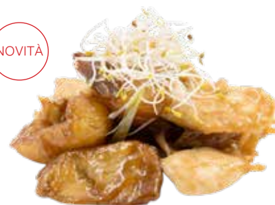
204 · POLLO CON PATATE | € 6,50 Petto di pollo saltato con patate allergeni: 1-3-6-14