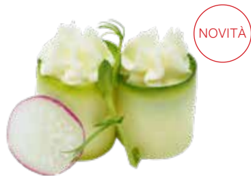
107 · TEMARI ZUCCHINA € 3,00

Bocconcini di riso avvolti con zucchini tagliata sottile, guarniti con Philadelphia allergeni: 7