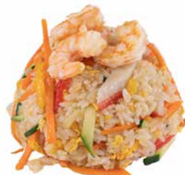
167 · KAISEN GOHAN € 6,50 Riso saltato con frutti di mare, verdure miste e uova allergeni: 1-2-3-4-6-14