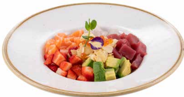
92 · POKE | € 14,00 Bocconcini di pesce misto su letto di riso con avocado, frutta di stagione, mandorle, ikura e tobiko* allergeni: 1-3-4-6-8