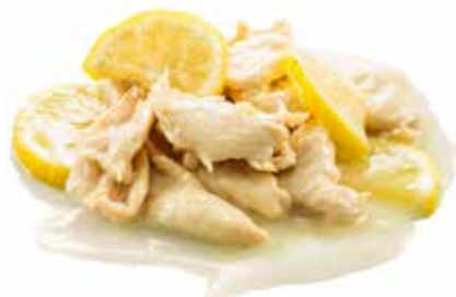
203 · POLLO AL LIMONE € 6,50 Petto di pollo saltato con salsa al limone allergeni: 3