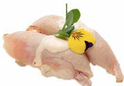
103 · TONNO CON SALSA TONNATA | € 5,00

Bocconcini di riso con salmone scottato, mandorle e salsa teriyaki allergeni: 1-4-6-8