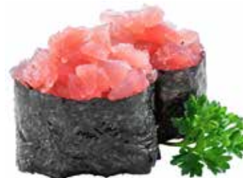
113 · MAGURO | € 4,50

Bocconcini di riso avvolti con alga nori, guarniti con tartare di salmone e tobiko* allergeni: 1-3-4-6-10