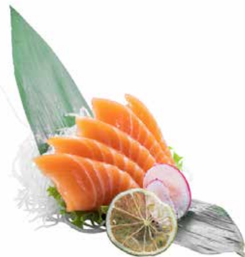
145 · SASHIMI SALMONE | € 12,00