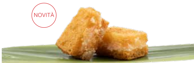
160 · TOAST DI GAMBERO | € 8,00 Toast croccante farcito con polpa di gambero e surimi allergeni: 1-2-3-4-12