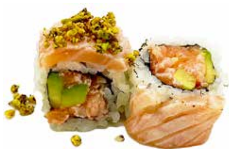
77 · ROLL SALMON SUMISO | € 14,00 🌶️

Roll di riso farcito con polpa di granchio e avocado, guarnito con fettine di salmone flambè, kataifi, salsa piccante, salsa teriyaki e tobiko* allergeni: 1-2-3-4-6-10