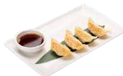
26 · EBI GYOZA GRILL € 6,50 Ravioli alla griglia con gamberi e verdure allergeni: 1-2-3-4-5-6-7-9- 11-12-14