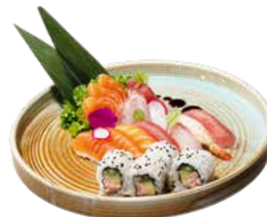
127 · SUSHI E SASHIMI MISTO | € 22,00 Sushi e sashimi assortiti (20 pezzi) allergeni: 1-2-4-6-7-11-14