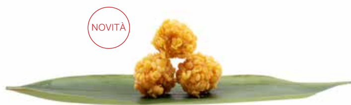
164 · POPCORN DI GAMBERO | € 8,00 Polpette di gamberi con una croccante panatura allergeni: 1-2