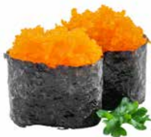
109 · TOBIKO | € 5,00

Bocconcini di riso guarniti con sesamo, Philadelphia, salsa teriyaki e kataifi allergeni: 1-6-7-11