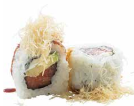
64 · FEVER | € 9,00 Roll di riso farcito con salmone, avocado e Philadelphia, guarnito con kataifi e salsa teriyaki allergeni: 1-4-6-7-11