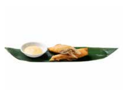
03 · INVOLTINO DI SALMONE | € 4,00 Sfoglia di salmone e mozzarella allergeni: 1-3-4-6-7-9