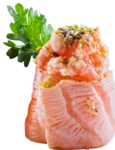
120 · GUNKAN PISTACCHIO € 5,00 🌶️

Bocconcini di riso avvolti con salmone, guarniti con Philadelphia, gamberi fritti e salsa agropiccante allergeni: 1-2-4-7