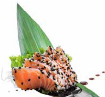
189 · SAKE TATAKI | € 9,00 Salmone scottato con sesamo e salsa teriyaki allergeni: 1-4-6-11