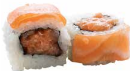
65 · JINO ROLL € 13,00 🌶️ Roll di riso farcito con tartare di salmone, guarnito con fettine di salmone, salsa teriyaki e tobiko* allergeni: 1-3-4-6-10