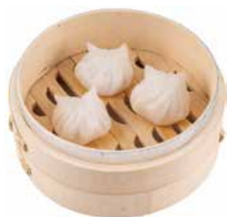
27 · GYOZA GAMBERO € 7,50 Ravioli di pasta di riso ripieni di gamberi allergeni: 1-2-6-9-11-14