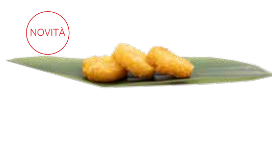
08 · MEDAGLIONE DI PATATE € 3,50 Medaglioni di patate fritti allergeni: 1-3-6-7-9-13