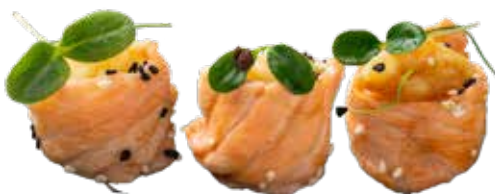
184 · SAKE IMOYAKI | € 7,00 Salmone arrotolato con sesamo, purea di patate e salsa imoyaki allergeni: 1-3-4-6-7-11