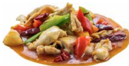
200 · POLLO AGROPICCANTE | € 6,50 🌶️ Petto di pollo saltato con verdure e salsa agropiccante allergeni: 1-3-6-14