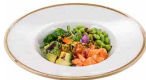
93 · POKE SALMON | € 14,00 Bocconcini di salmone su letto di riso con edamame, avocado, pistacchio, goma wakame, mayo e salsa teriyaki allergeni: 1-3-4-6-8-10-11