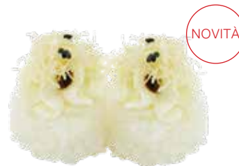
108 · WHITE TEMARI € 3,00

Bocconcini di riso avvolti con zucchini tagliata sottile, guarniti con Philadelphia allergeni: 7