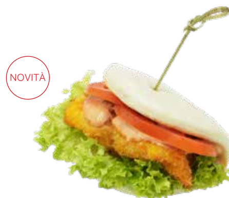
15 · GUABAO DI GAMBERO € 6,00 Pane orientale ripieno di gamberi, lattuga, pomodoro e salsa rosa allergeni: 1-2-3-4-6-7-10