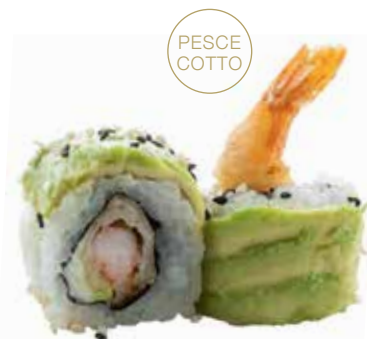
66 · EBI YUZU ROLL € 12,00 🌶️ Roll di riso farcito con gamberi in tempura, philadelphia, guarnito con avocado, tartare di salmone, salsa yuzu, sesamo, e kataifi allergeni: 1-2-3-4-6-7-10-11