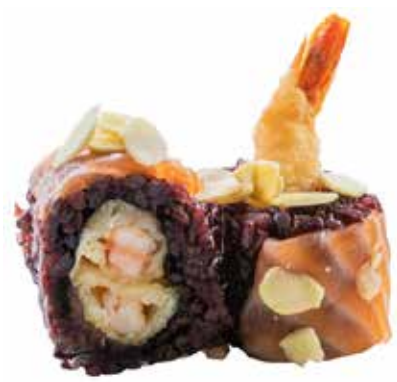
78 · EBI FLO' | € 12,00

Roll di riso farcito con tartare di salmone piccante e avocado, guarnito con salmone flambè, granella di pistacchio e yuzumiso allergeni: 1-3-4-6-8-10