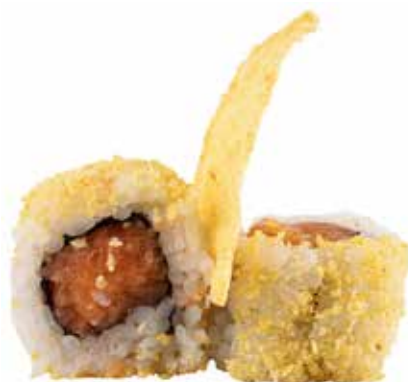
63 · TACOS ROLL | € 10,00 🌶️ Roll di riso farcito con tartare di salmone, guarnito con nachos e spicy mayo allergeni: 1-3-4-6-10