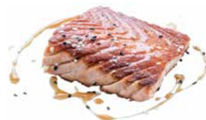
186 · SAKE YAKI | € 9,00 Salmone alla griglia con sesamo e salsa teriyaki allergeni: 1-4-6-11