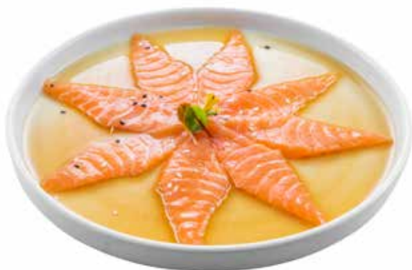
142 · CARPACCIO DI SALMONE | € 11,00