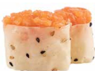
110 · SOY SALMON | € 3,50

Bocconcini di riso avvolti con alga nori, guarniti con tartare di tonno e tobiko* allergeni: 1-3-4-6-10