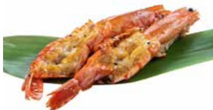
185 · EBI YAKI | € 10,00 Gamberoni alla griglia con sesamo e salsa teriyaki allergeni: 1-2-6-11