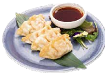
22 · GYOZA POLLO FRITTO € 5,50 Ravioli giapponesi fritti con pollo e verdure allergeni: 1-3-6-7-8