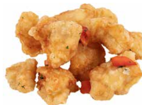
201 · POLLO SALE E PEPE | € 7,00 🌶️ Petto di pollo croccante con sale e pepe allergeni: 1-3