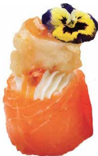
119 · GUNKAN SALMONE GAMBERO FRITTO SALSA AGROPICCANTE | € 5,00 🌶️

Bocconcini di riso avvolti con tonno, guarniti con tartare di tonno condita con salsa speziata allergeni: 1-3-4-6-10