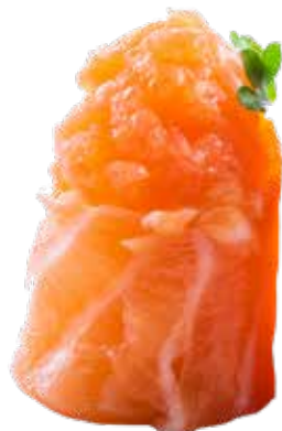
116 · GIO SPICY SALMON € 4,50 🌶️

Bocconcini di riso avvolti con salmone, guarniti con Philadelphia e frutta di stagione allergeni: 4-7