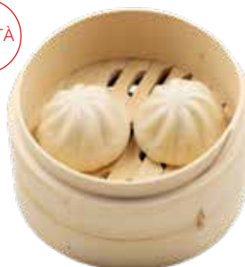
28 · XIAOLONGBAO | € 5,50 Pane orientale farcito con carne di maiale, lardo, cavolo cappuccio, erba cipollina e cipolla allergeni: 1-6-7-9-11-14