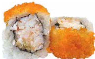
62 · YONG ROLL | € 9,00 Roll di riso farcito con gambero cotto e granella di tempura, guarnito con tobiko* e condito con salsa teriyaki allergeni: 1-2-4-6