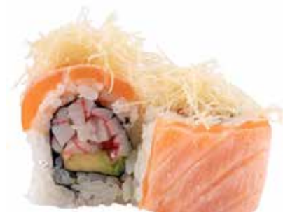
76 · IBIZA ROLL | € 12,00 🌶️

Roll di riso farcito con salmone, avocado e Philadelphia, guarnito con avocado e salsa teriyaki allergeni: 1-4-6-7