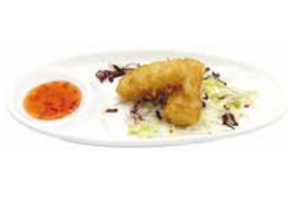
02 · HARUMAKI THAI | € 5,00 Involtino di pasta sfoglia con gamberi e lardo allergeni: 1-2-3-7-14