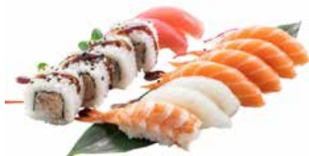
126 · SUSHI MIX | € 16,00 Sushi assortito (13 pezzi) tobiko* allergeni: 1-2-4-6-7-8-11