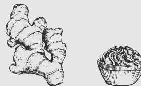
ZENZERO E WASABI