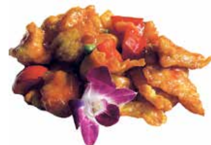
202 · POLLO IN AGRODOLCE | € 6,50 Petto di pollo saltato con salsa agrodolce allergeni: 3-6