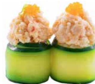
114 · ZUCCHINA | € 4,00

Bocconcini di riso avvolti con carta di soia con sesamo, guarniti con tartare di gambero e tobiko* allergeni: 1-2-3-4-6-10-11