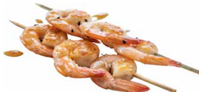
187 · EBI NO KUSHIYAKI | € 9,00 Spiedini di gamberetti alla griglia con sesamo e salsa teriyaki allergeni: 1-2-6-11