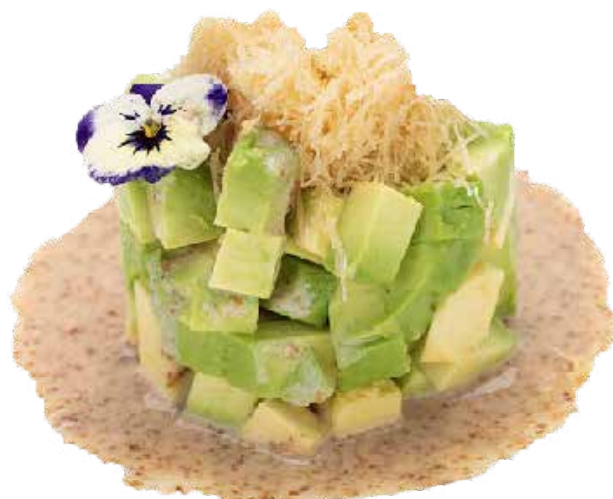
141 · TARTARE AVOCADO KATAIFI, SESAMO DRESSING | € 9,00 🌿

Tartare di avocado, kataifi, sesamo dressing