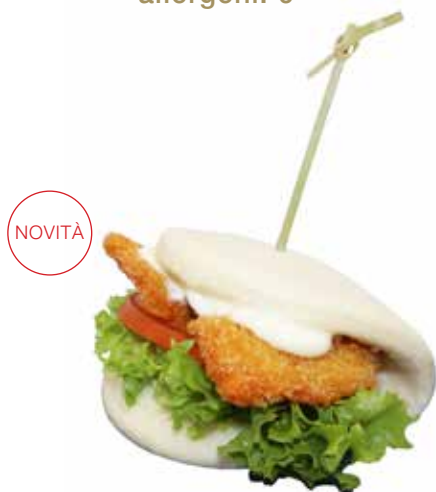
14 · GUABAO DI POLLO € 5,50 Pane orientale ripieno di pollo, lattuga, pomodoro e maionese allergeni: 1-3-6-7-10