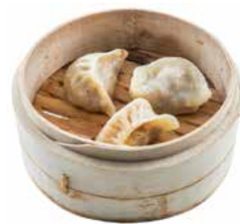
23 · RAVIOLI NIKU | € 5,50 Ravioli con carne e verdure allergeni: 1-2-3-4-6-8-9-10- 12-14