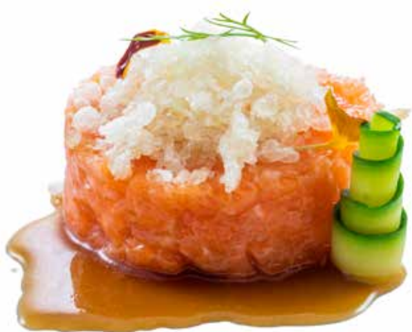
140 · SAKE TARTARE | € 12,50 🌶