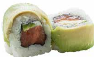
75 · DRAGON ROLL € 12,00

Roll di riso farcito con tartare di salmone, tobiko* , guarnito con gamberi alla griglia, erba cipollina, salsa teriyaki e sesamo allergeni: 1-2-3-4-6-10-11