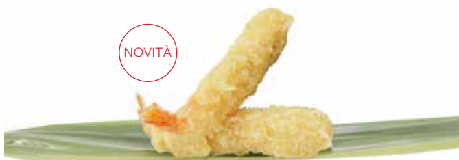
163 · GAMBERO IMPANATO | € 8,00 Frittura di gambero impanato allergeni: 2-4-6-11