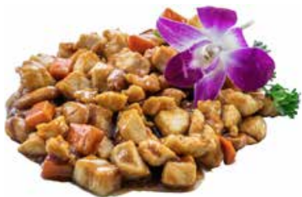
199 · POLLO ALLE MANDORLE | € 6,50 Petto di pollo saltato con mandorle e carote allergeni: 1-3-6-8-14