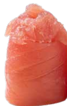
117 · GIO SPICY TUNA € 4,50 🌶️

Bocconcini di riso avvolti con salmone, guarniti con tartare di salmone condita con salsa speziata e tobiko* allergeni: 1-3-4-6-10