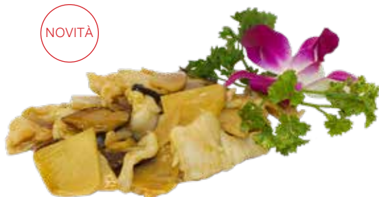
205 · POLLO, FUNGHI E BAMBÙ | € 6,50 Petto di pollo saltato con funghi* e bambù allergeni: 1-3-6-14