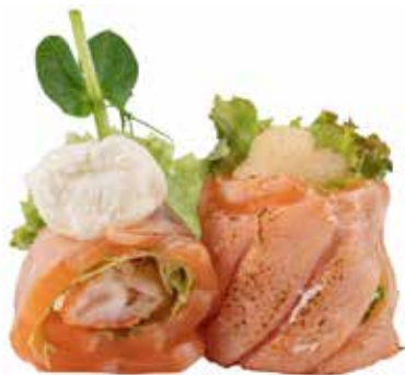
136 · NICETY EBI | € 8,00 Delicati bocconcini con tempura di gamberi, Philadelphia e insalata, avvolti con salmone scottato e conditi con salsa teriyaki allergeni: 1-2-4-6-7