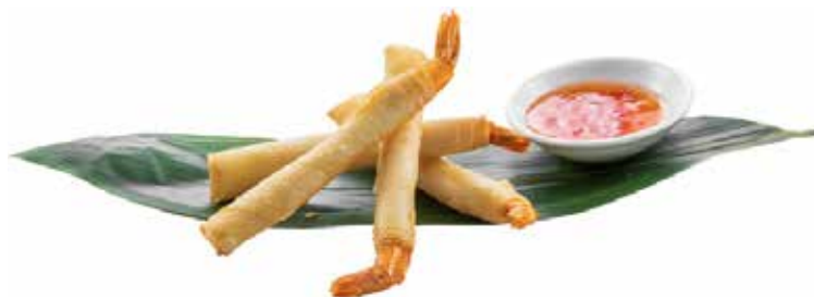
161 · EBI STICK | € 6,00 Involtino croccante di gambero fritto con salsa speciale allergeni: 1-2-3-7