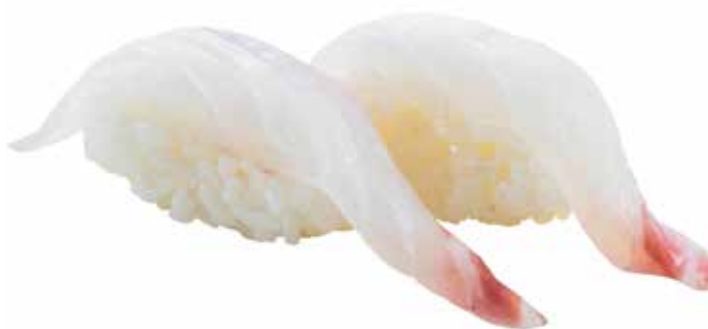
97 · TAI | € 3,50 Bocconcini di riso con branzino allergeni: 4