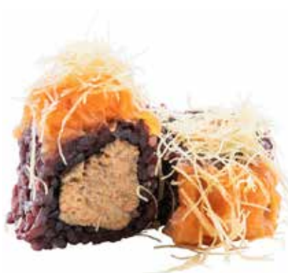
79 · MIURA PLUS € 12,00 🌶️

Roll di riso venere farcito con gamberoni in tempura e Philadelphia, guarnito con salmone, mandorle e salsa teriyaki allergeni: 1-2-4-6-7-8