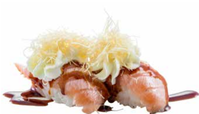
100 · SALMONE FLAMBÈ E PHILADELPHIA | € 4,50

Bocconcini di riso con salmone scottato, Philadelphia e salsa teriyaki allergeni: 1-4-6-7