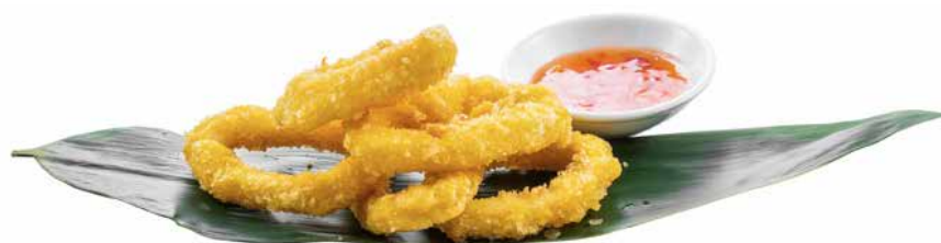
162 · IKA KARAGA | € 8,00 Frittura di calamaro impanato allergeni: 1-3-14