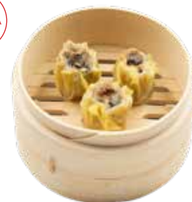
29 · POLLO SHUMAY | € 6,00 Ravioli con pollo, funghi, erba cipollina e cipolla allergeni: 1-6-9-11-14