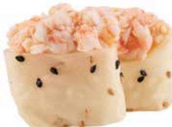
111 · SOY GAMBERO | € 4,00

Bocconcini di riso avvolti con carta di soia con sesamo, guarniti con tartare di salmone e tobiko* allergeni: 1-3-4-6-10-11