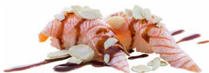
102 · NIGIRI MANDORLE | € 4,50

Bocconcini di riso con salmone scottato, pistacchi e salsa teriyaki allergeni: 1-4-6-8