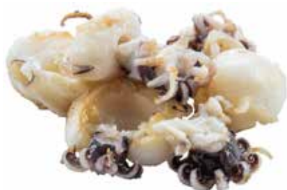
188 · SEPPIOLINE ALLA GRIGLIA | € 9,00 Seppie alla griglia allergeni: 14