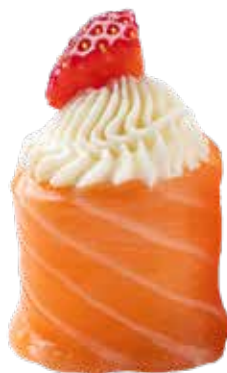
115 · GIO TROPICAL € 4,50

Bocconcini di riso avvolti con salmone, guarniti con Philadelphia e frutta di stagione allergeni: 4-7