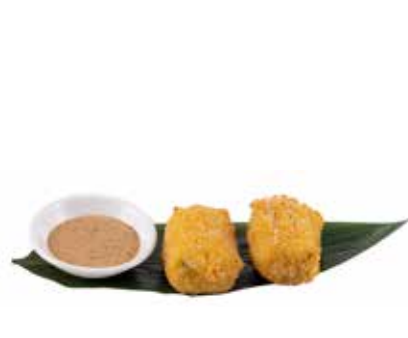
04 · CROCCHETTE DI SALMONE | € 5,00 Polpette croccanti di salmone e patate allergeni: 1-3-4-6-7