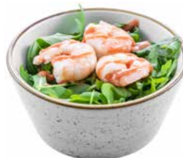
13 · COCKTAIL DI GAMBERETTI € 6,00 Gamberetti con salsa rosa allergeni: 1-2-3-4-6-10