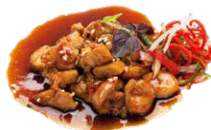
190 · YAKITORI | € 8,00 Pollo alla griglia con sesamo salsa teriyaki e porro allergeni: 1-6-11-14