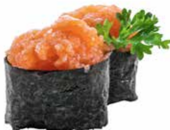
112 · SAKE | € 3,50

Bocconcini di riso avvolti con alga neri e ripieno di tobiko* allergeni: 4