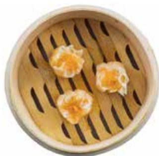
24 · RAVIOLI SHUMAY € 6,50 Ravioli con gamberi, carne, verdure e lardo allergeni: 1-2-3-4-6-9-11-12- 14