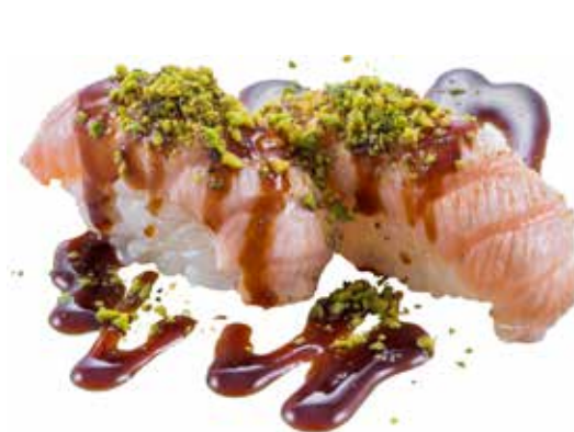
101 · SALMONE FLAMBÈ AL PISTACCHIO | € 4,50

Bocconcini di riso con salmone scottato, Philadelphia e salsa teriyaki allergeni: 1-4-6-7