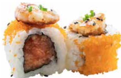
74 · FUSION ROLL € 12,00 🌶️

Roll di riso farcito con tartare di salmone, tobiko* , guarnito con gamberi alla griglia, erba cipollina, salsa teriyaki e sesamo allergeni: 1-2-3-4-6-10-11