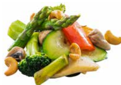
213 · VERDURE MISTE | € 4,00 🌿 Verdure miste di stagione saltate e funghi* allergeni: 6-8-11