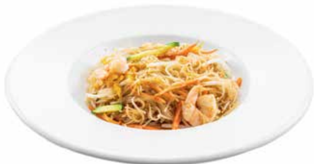
180 · SPAGHETTI DI RISO IMPERIALI | € 6,50 Spaghetti di riso saltati con gamberetti, verdure e uova allergeni: 1-2-3-6-14