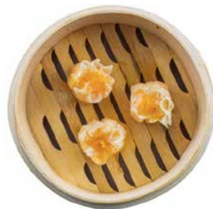
24 · RAVIOLI SHUMAY | € 6,00 Ravioli con gamberi, carne, verdure e lardo allergeni: 1-2-3-4-6-9-11-12-14