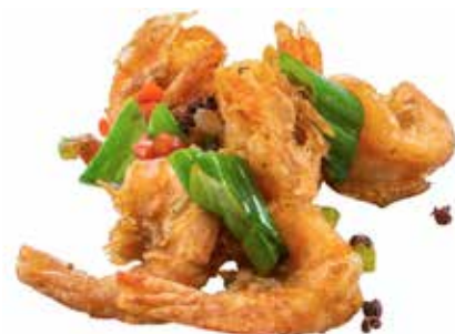
208 · GAMBERI SALE E PEPE | € 8,00 🌶️ Gamberi saltati con verdure allergeni: 1-2-3