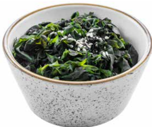
11 · WAKAME | € 4,50 🌿 Alghe con sesamo allergeni: 1-6-11