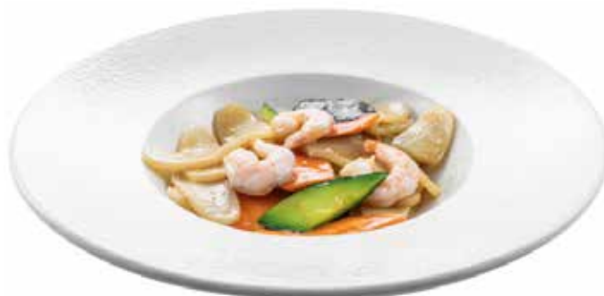
181 · GNOCCHI DI RISO E GAMBERI | € 7,00 Gnocchi di riso saltati con gamberi e verdure e funghi* allergeni: 1-2-6-14