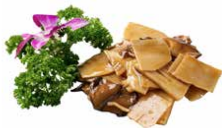
212 · FUNGHI E BAMBÙ | € 4,00 🌿 Funghi* e bambù saltati allergeni: 1-6-14