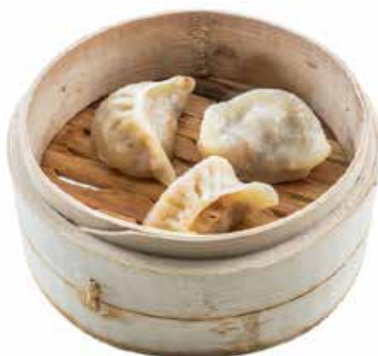
23 · RAVIOLI NIKU | € 5,50 Ravioli con carne e verdure allergeni: 1-2-3-4-6-8-9-10-12-14