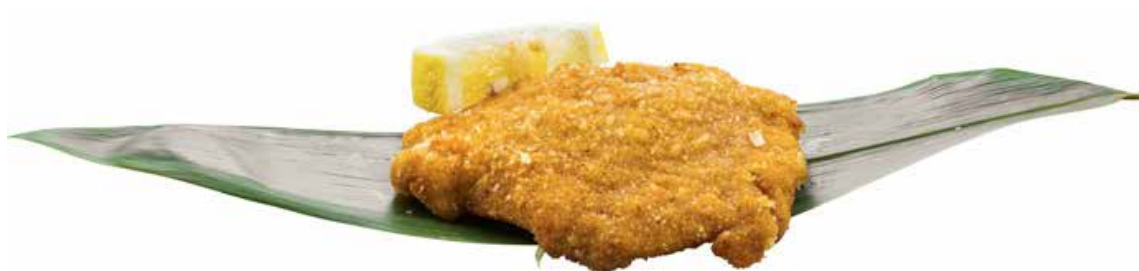
156 · COTOLETTA DI MAIALE | € 7,00 Cotoletta di maiale impanata allergeni: 1-3-6-11