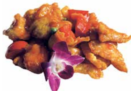
202 · POLLO IN AGRODOLCE | € 6,50 Petto di pollo saltato con salsa agrodolce allergeni: 3-6