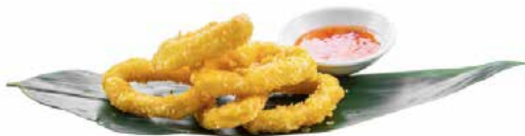
162 · IKA KARAGA | € 8,00 Frittura di calamaro impanato allergeni: 1-3-14