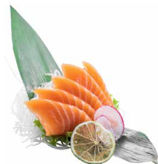
145 · SASHIMI SALMONE | € 12,00