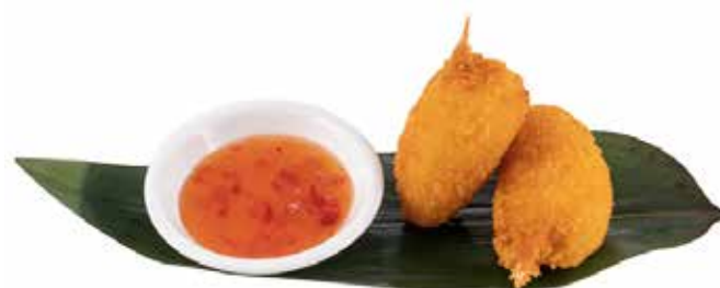
157 · CHELE DI GRANCHIO | € 6,00 Frittura di chele di granchio impanate allergeni: 1-2-3-4-6