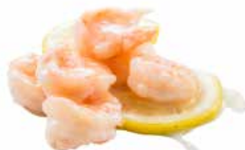
211 · GAMBERETTI AL LIMONE | € 9,00 Gamberetti con salsa al limone allergeni: 2-3