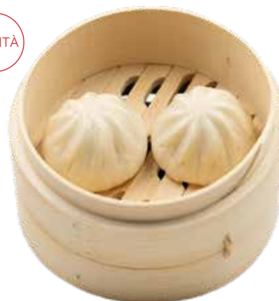
28 · XIAOLONGBAO | € 5,50 Pane orientale farcito con carne di maiale, lardo, cavolo cappuccio, erba cipollina e cipolla allergeni: 1-6-7-9-11-14