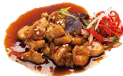
190 · YAKITORI | € 8,00 Pollo alla griglia con sesamo salsa teriyaki e porro allergeni: 1-6-11-14