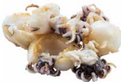
188 · SEPPIOLINE ALLA GRIGLIA | € 9,00 Seppie alla griglia allergeni: 14