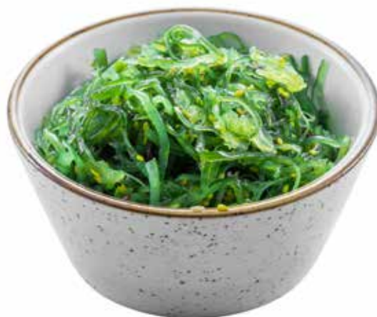
10 · GOMA WAKAME | € 4,50 🌿 🌶️ Alghe agropiccanti allergeni: 1-6-11