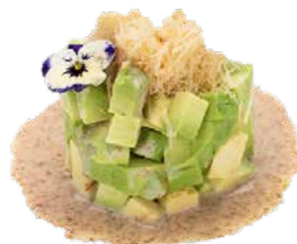
141 · TARTARE AVOCADO KATAIFI, SESAMO DRESSING