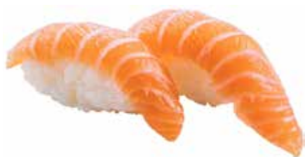
95 · SAKE | € 3,50 Bocconcini di riso con salmone allergeni: 4