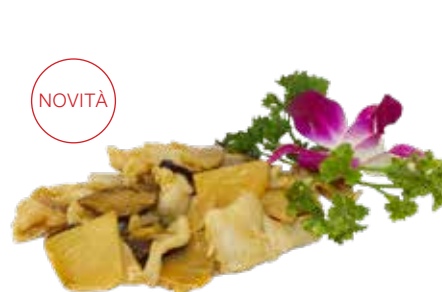
205 · POLLO, FUNGHI E BAMBÙ | € 6,50 Petto di pollo saltato con funghi* e bambù allergeni: 1-3-6-14