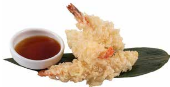
158 · EBI TEMPURA | € 12,00 Tempura di gamberi allergeni: 1-2