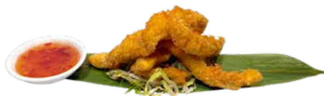
155 · TORIKARAGE | € 6,00 Bocconcini di pollo fritti allergeni: 1-3-6-11