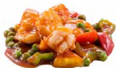
210 · GAMBERI AGRODOLCE | € 9,00 Gamberi con salsa agrodolce allergeni: 2-3