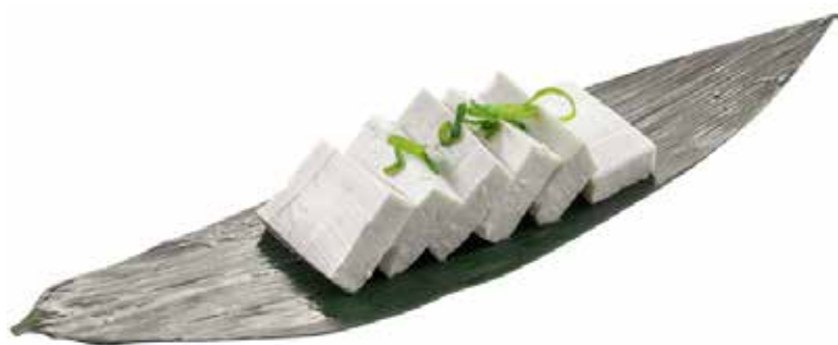
09 · TOFU | € 3,00 🌿 Tofu con salsa di soia allergeni: 1-6