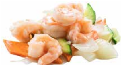
206 · GAMBERI AI CINQUE COLORI | € 8,00 Gamberi con cinque tipi di verdure allergeni: 2-3-9