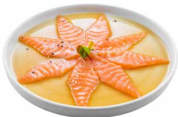
142 · CARPACCIO DI SALMONE | € 11,00