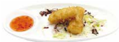
02 · HARUMAKI THAI | € 5,00 Involtino di pasta sfoglia con gamberi e lardo allergeni: 1-2-3-7-14