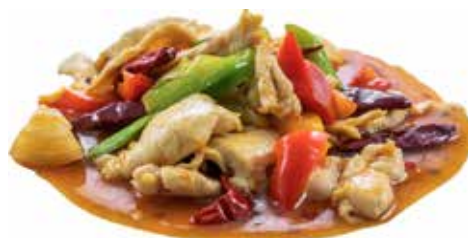
200 · POLLO AGROPICCANTE | € 6,50 🌶️ Petto di pollo saltato con verdure e salsa agropiccante allergeni: 1-3-6-14