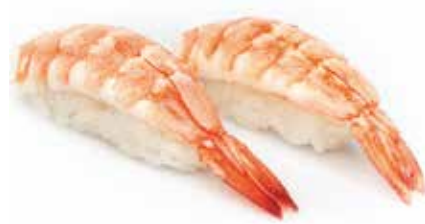
99 · EBI | € 3,50 Bocconcini di riso con gambero cotto allergeni: 2