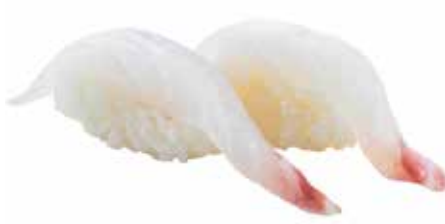
97 · TAI | € 3,50 Bocconcini di riso con branzino allergeni: 4