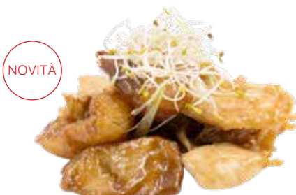
204 · POLLO CON PATATE € 6,50 Petto di pollo saltato con patate allergeni: 1-3-6-14