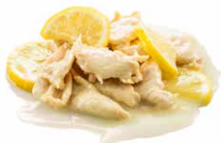
203 · POLLO AL LIMONE € 6,50 Petto di pollo saltato con salsa al limone allergeni: 3