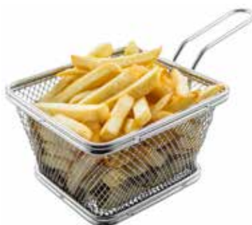
05 · PATATINE FRITTE € 3,50 🌿 Stick di patate allergeni: 1