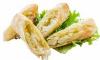
01 · HARUMAKI | € 3,50 🌿 Involtino di pasta sfoglia alle verdure allergeni: 1-3-7