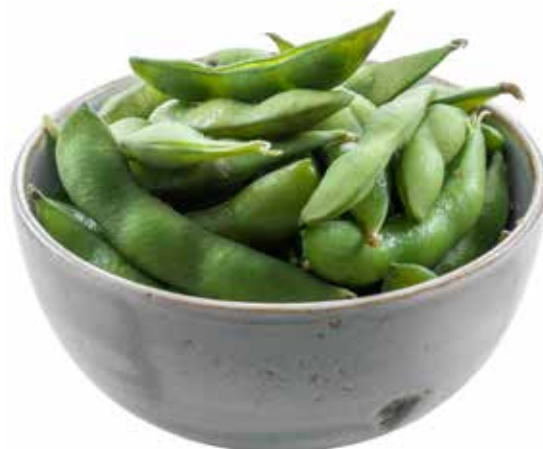
12 · EDAMAME | € 4,50 🌿 Baccelli di soia allergeni: 6