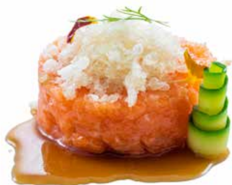
140 · SAKE TARTARE | € 12,50 🌶️