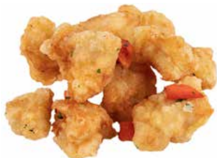
201 · POLLO SALE E PEPE | € 7,00 🌶️ Petto di pollo croccante con sale e pepe allergeni: 1-3