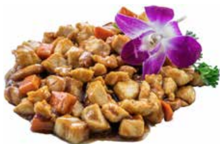
199 · POLLO ALLE MANDORLE | € 6,50 Petto di pollo saltato con mandorle e carote allergeni: 1-3-6-8-14