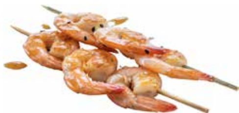
187 · EBI NO KUSHIYAKI € 9,00 Spiedini di gamberetti alla griglia con sesamo e salsa teriyaki allergeni: 1-2-6-11