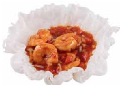
207 · GAMBERETTI THAI | € 8,00 🌶️ Gamberetti alla thailandese allergeni: 1-2-3-6